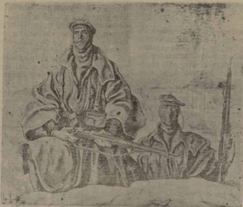
DOS SOLDADOS NACIONALES EN EL FRENTE

Lea usted «EL NOTICIERO» todos los lunes