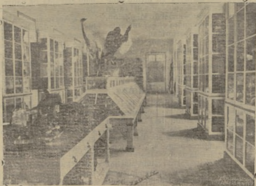
Detalle de una de las salas del Museo Municipal

Cuenta el Museo con salas de escultura y de armas, así como otra de Historia Natural, dividida en secciones, destacándose la dedicada a la colección de lepidópteros, que es verdaderamente espléndida, por su cantidad, constituyendo esta colección una de las más interesantes atracciones del Museo, que también posee variedades de Zoología y una colección de minerales del país, todo perfectamente clasificado.