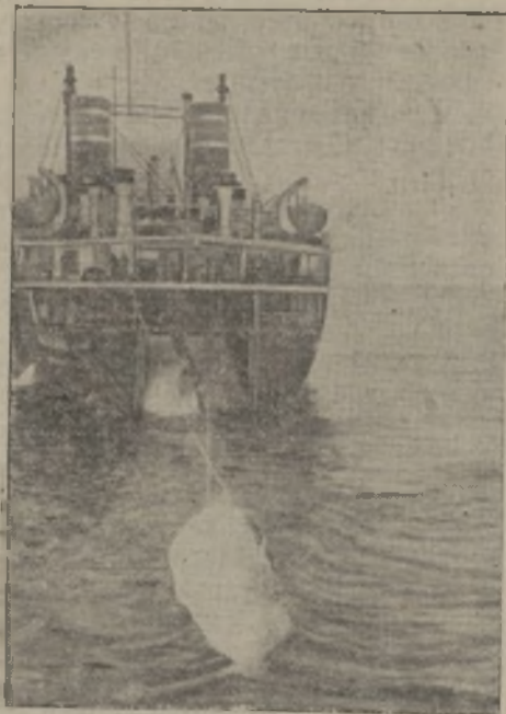
Recogida por el buque-nodriz de dos ballenas cazadas.

El aparato tiene un peso de 15 kilogramos solamente, siendo su altura de 50 centímetros con un diámetro de 30 centímetros. Dispuesto en una caja de acero inoxidable que cierra herméticamente, el emisor minúsculo utiliza, como válvula emisora, la válvula Telefunken del tipo RE 134, siendo suministrada la corriente necesi-