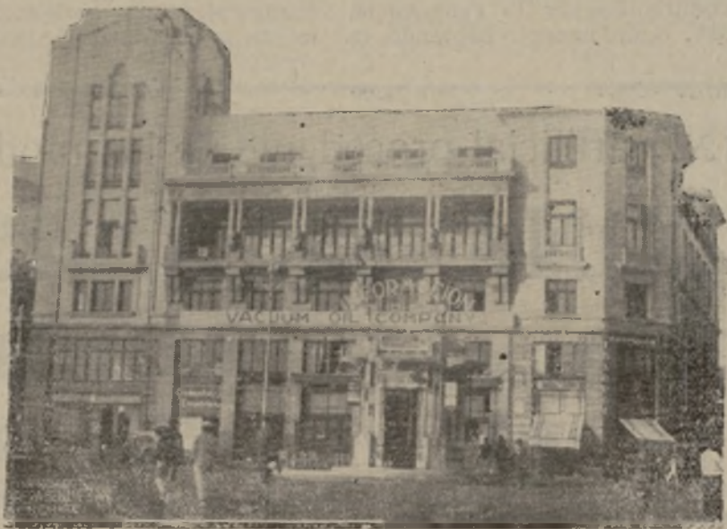
Perspectiva que ofrece el suntuoso edificio del Casino de Tenerife por la parte que mira al mar, y desde cuyas terrazas se domina todo el muelle y su espléndida bahía.

Mucho nos satisface la rapidez dada a las obras, pues ello es prueba inequívoca de que pronto contará el