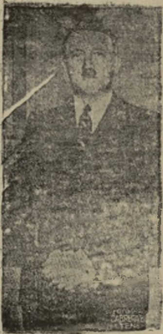
ADOLFO HITLER. FUHRER CANCELLER DE NUESTRA NACION. AMIGA LA IMPERIAL ALEMANIA

El día 2 del presente mes, se cumplió el 25 aniversario de la entrada de Alemania en la guerra mundial. Cumpliendo la voluntad del Fuhrer, se celebró dicha fecha en toda la nación alemana, para lo cual los jefes de los ejércitos de tierra, mar y aire dirigieron patrióticas órdenes a sus respectivos departamentos.