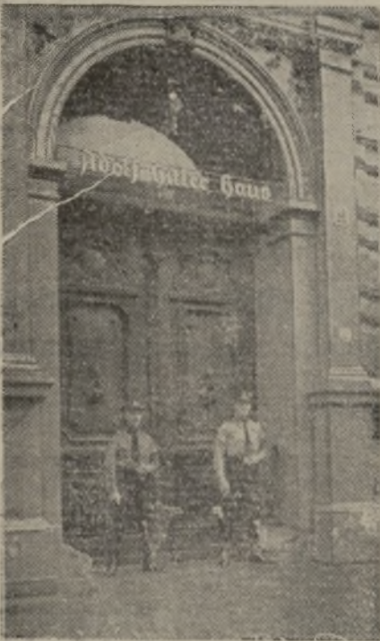
La casa de Adolfo Hitler, en Berlín, donde constantemente se halla una guardia de nazis, escogida entre los más fieles al Führer