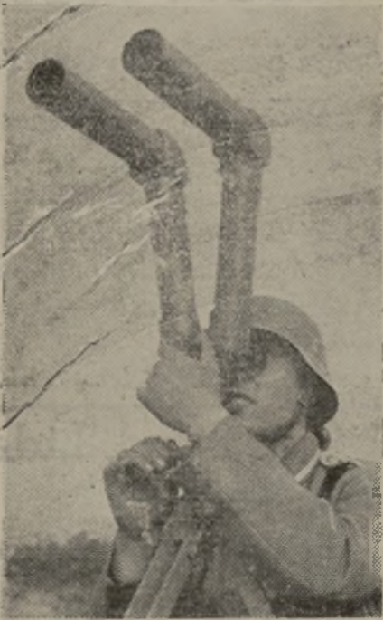
Los modernos aparatos largavistas, para los puestos de observación en campaña, adoptados últimamente por el ejército alemán