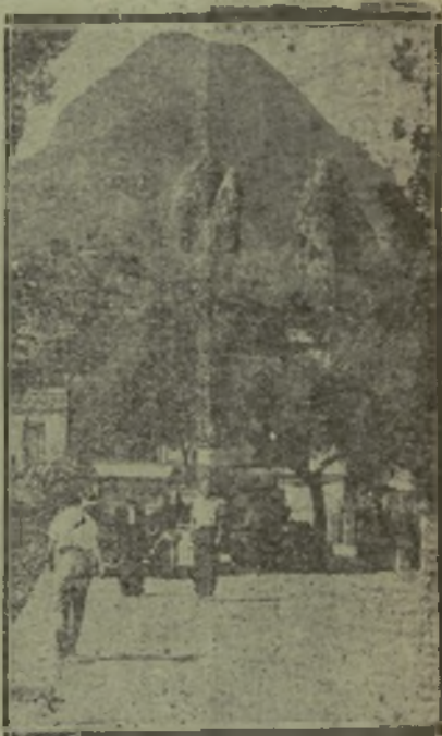
Perspectiva que ofrece un pueblo de La Palma, en la que se destaca la imponente mole de sus abruptas montañas, que le prestan interés y relieve.