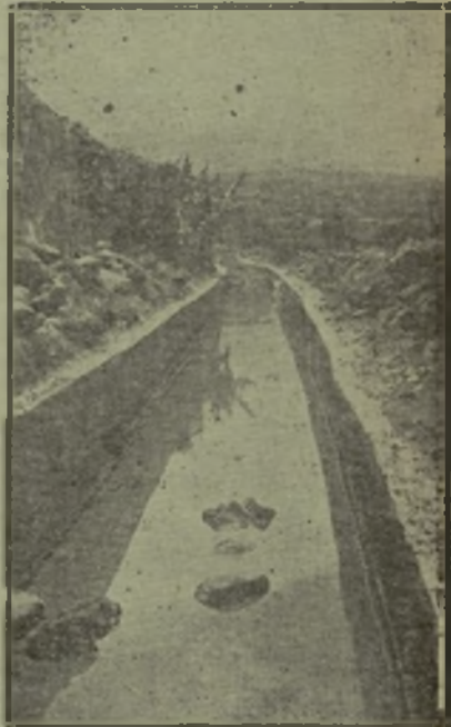
Canal de 5.091 a 5.400 metros de largo, 60 centímetros de alto y 125 centímetros de ancho, cuyas aguas riegan una extensa zona agrícola de La Palma.