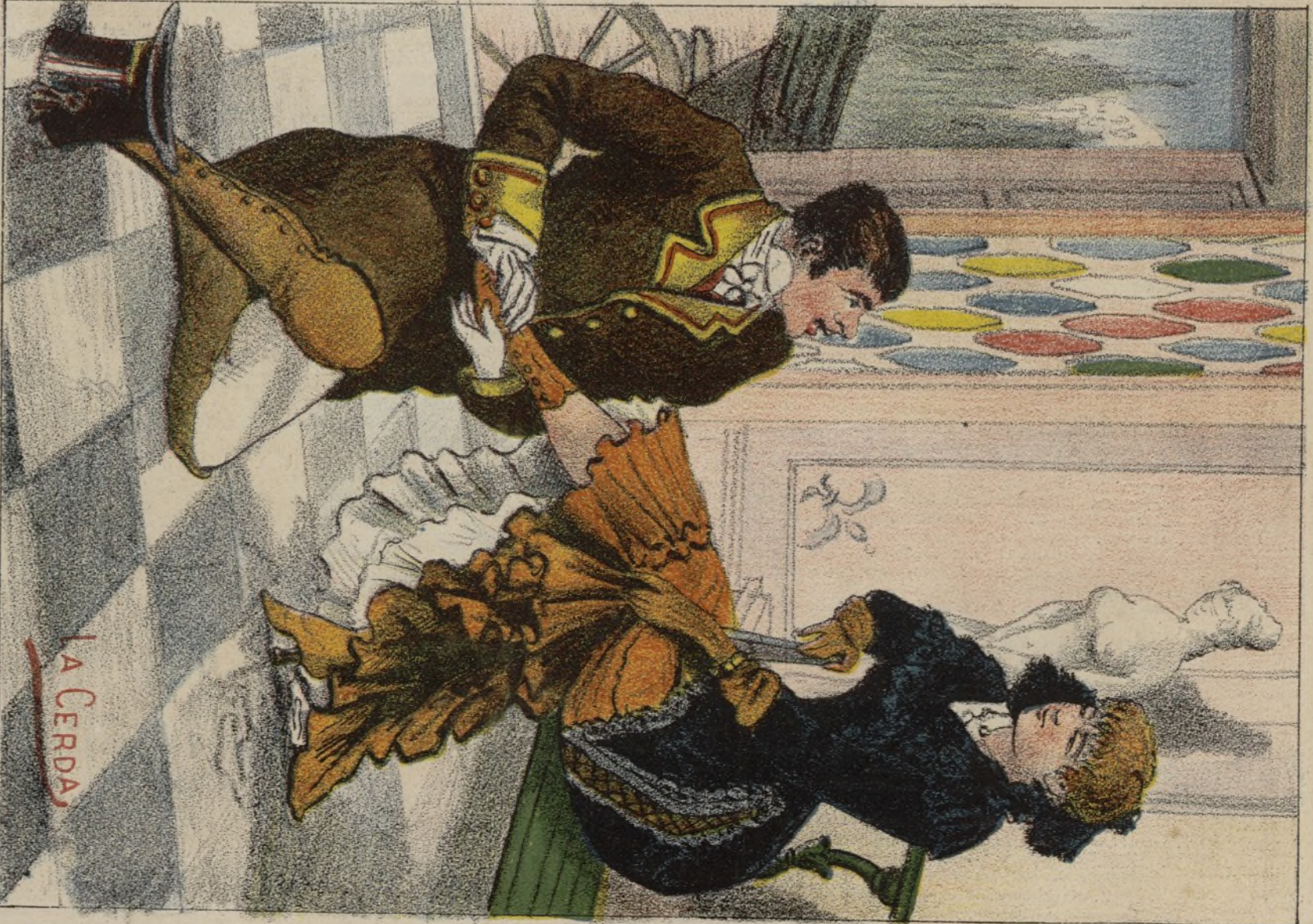
Enseñanza á doméstico.