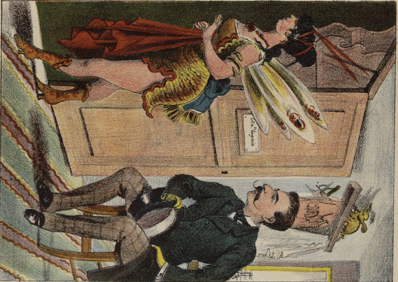
Enseñanza preparatoria para toda clase de carreras.