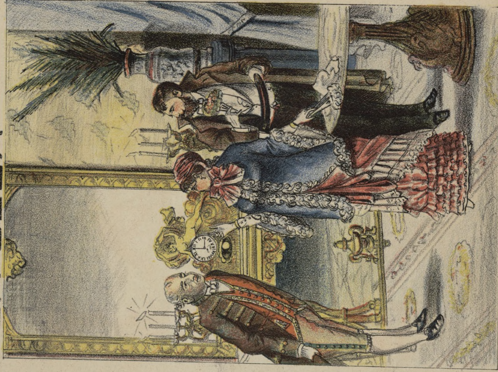
TRES MESES DESPUES.

-Ma.belle, un compromiso de amigos, me obliga á alejarme esta noche de tu lado. -Buen principio!