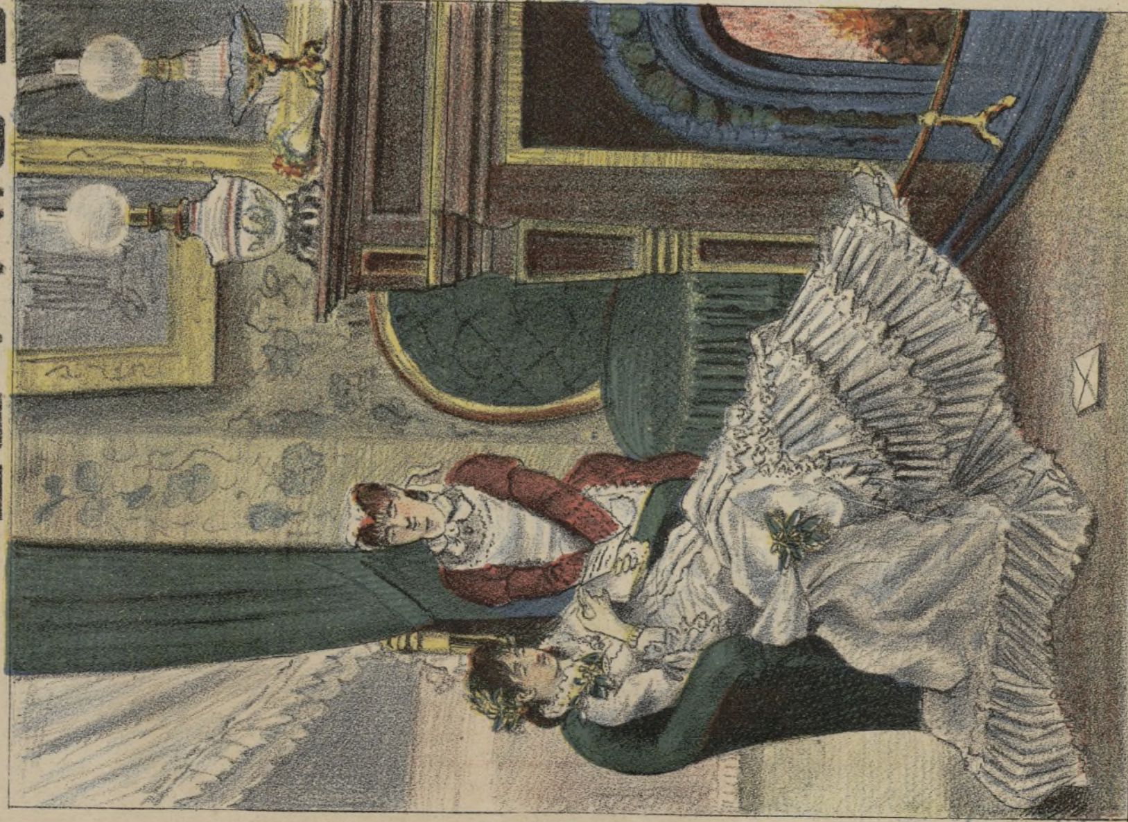
LA NOCHE DE BODAS.

-Ma.belle, un compromiso de amigos, me obliga á alejarme esta noche de tu lado. -Buen principio!