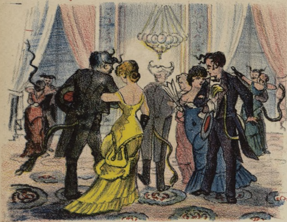
El demonio son los hombres