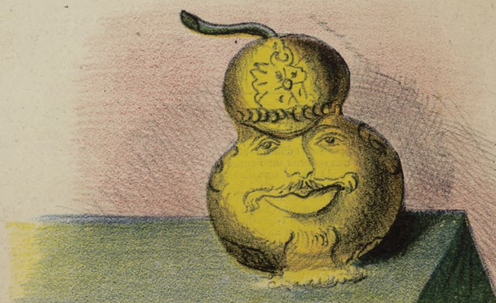
La semilla del quebranto,