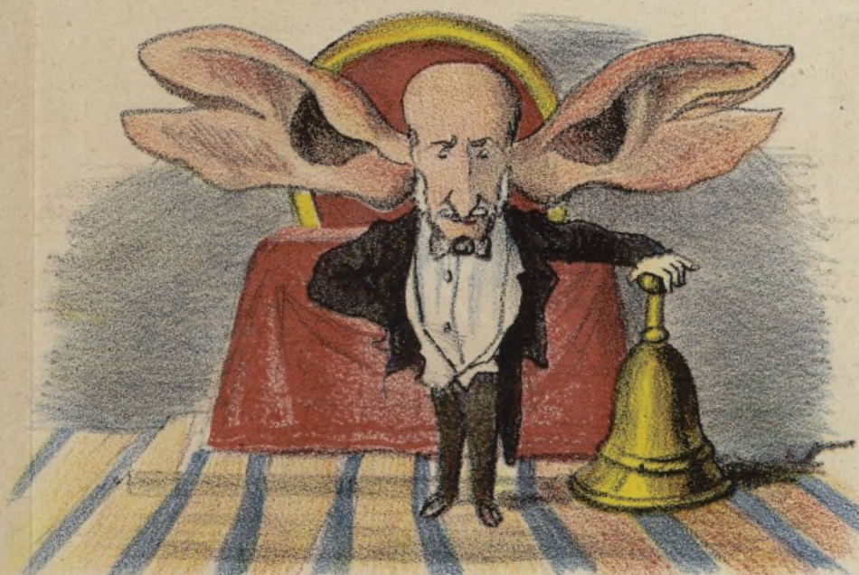
Es lo mismo que si un calvo