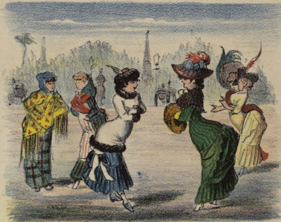
Segun dicen las mugeres,