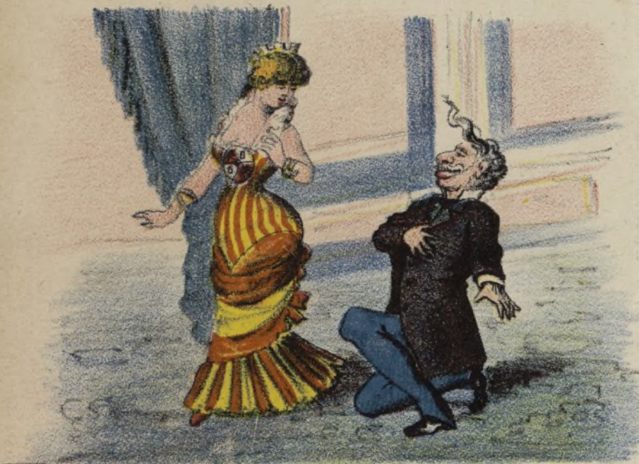
Cuando uno quiere á una