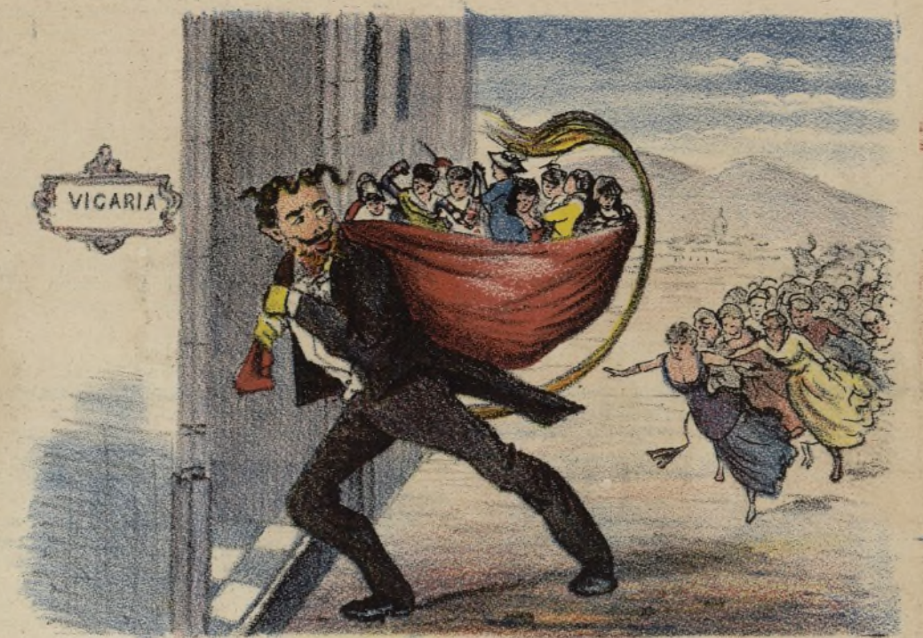
Que el demonio se las lleve.