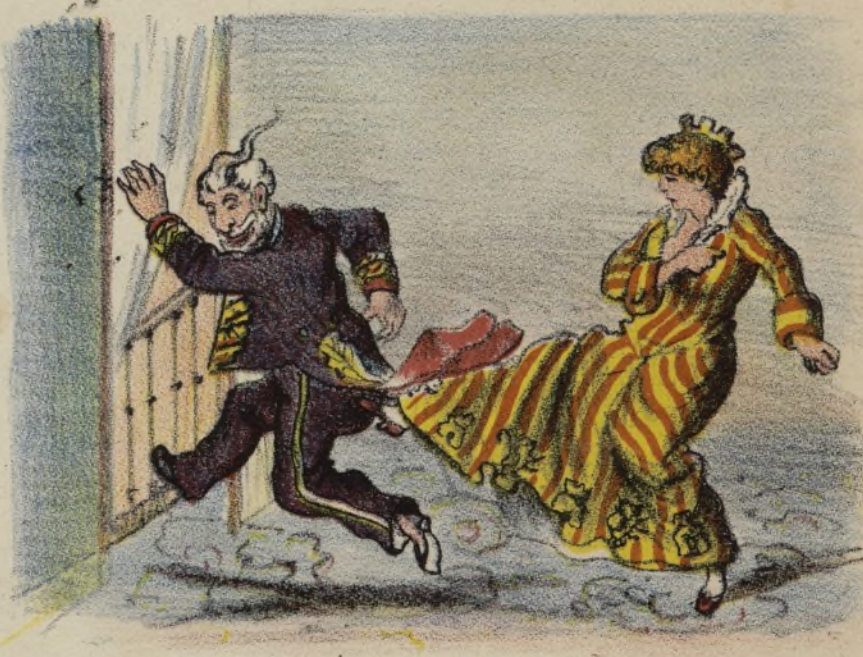
Y esta una no le quiere,