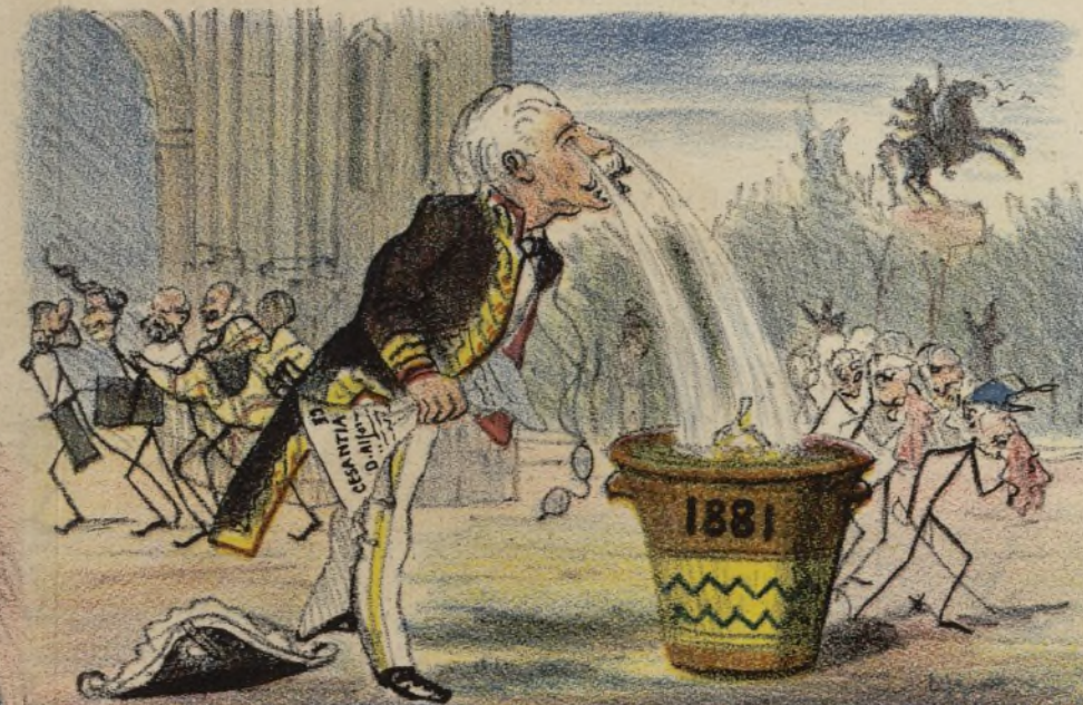
Con lágrimas la regué