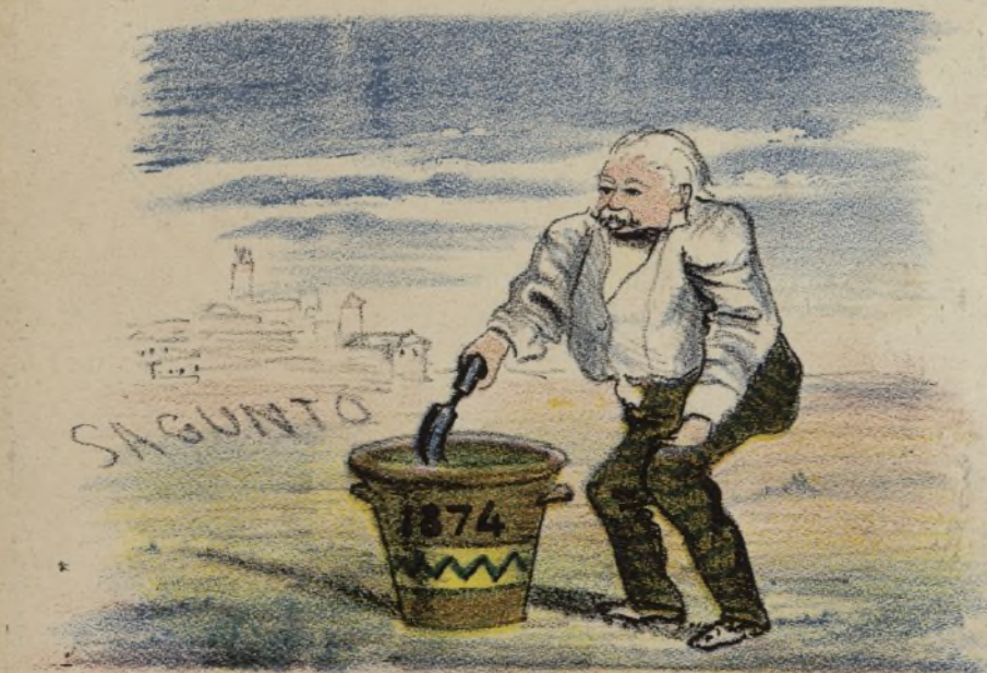
Yo sembré en una maceta