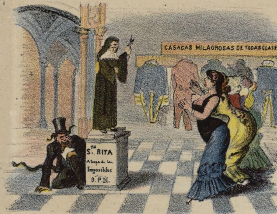
Y el dia pasan rogando