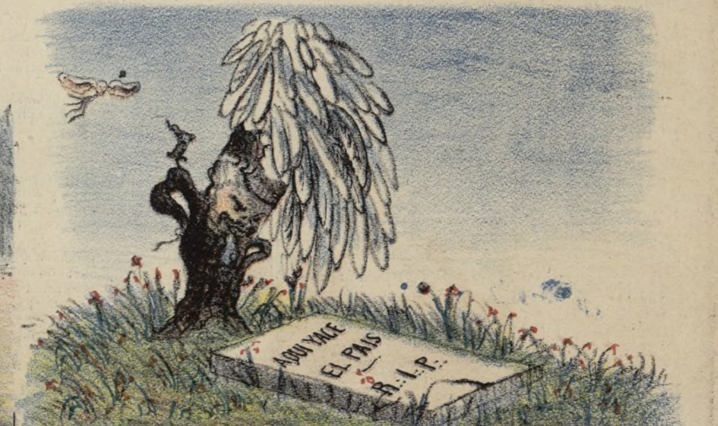
Y el árbol nació llorando.