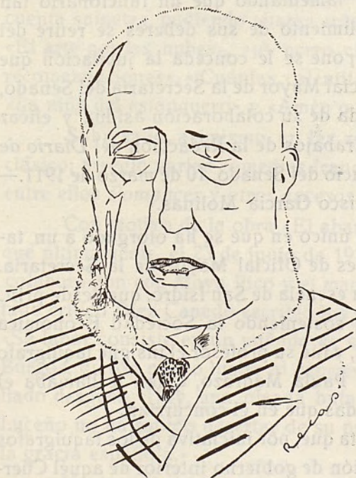
D. Tomás Luceño

El día 27 de este mes, a las seis y media de la tarde, falleció en Madrid el eximio taquígrafo e ilustre sainetero D. Tomás Luceño y Becerra, que perteneció a la Redacción del Diario de las Sesiones