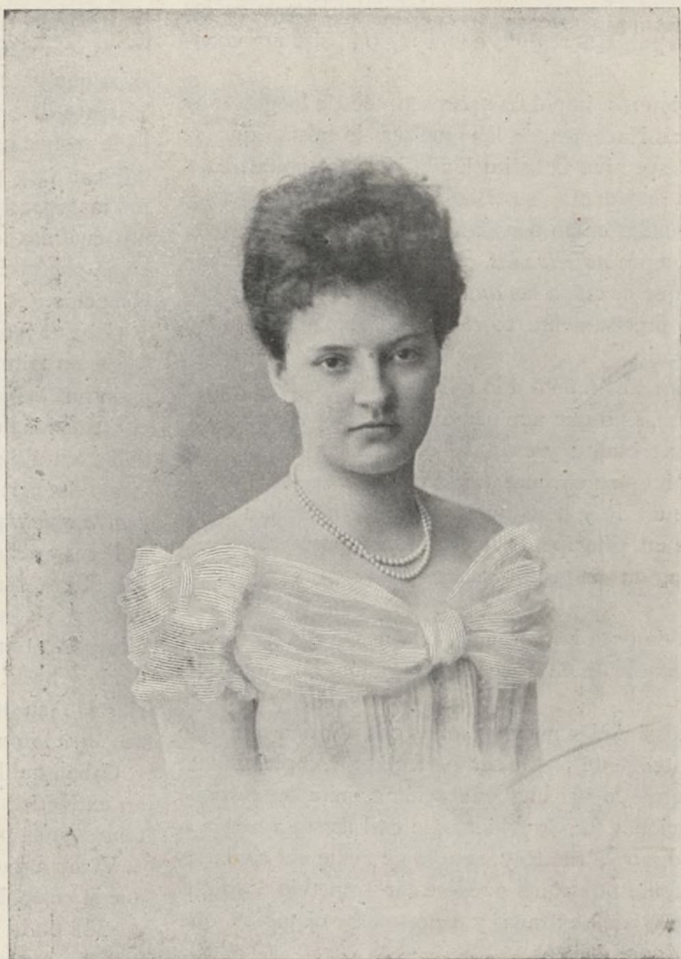
PRINCESA HILDEGARDA DE BAVIERA

DONATIVO DE LA BIBLIOTECA NACIONAL DE MADRID 1940