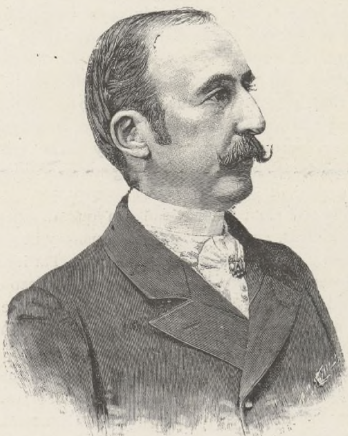
Excmo. Sr. D. Enrique Aguilera de Gamboa, Marqués de Cerralbo.

En el terreno político, la figura del Sr. Marqués de Cerralbo es tan conocida, que no necesita presentación. Diputado á Cortes por Ledesma en 1871, Senador en la actualidad por derecho propio y jefe hace largo tiempo del carlismo, en todos estos puestos ha dejado el sello de su personalidad, tan respetable como prestigiosa.