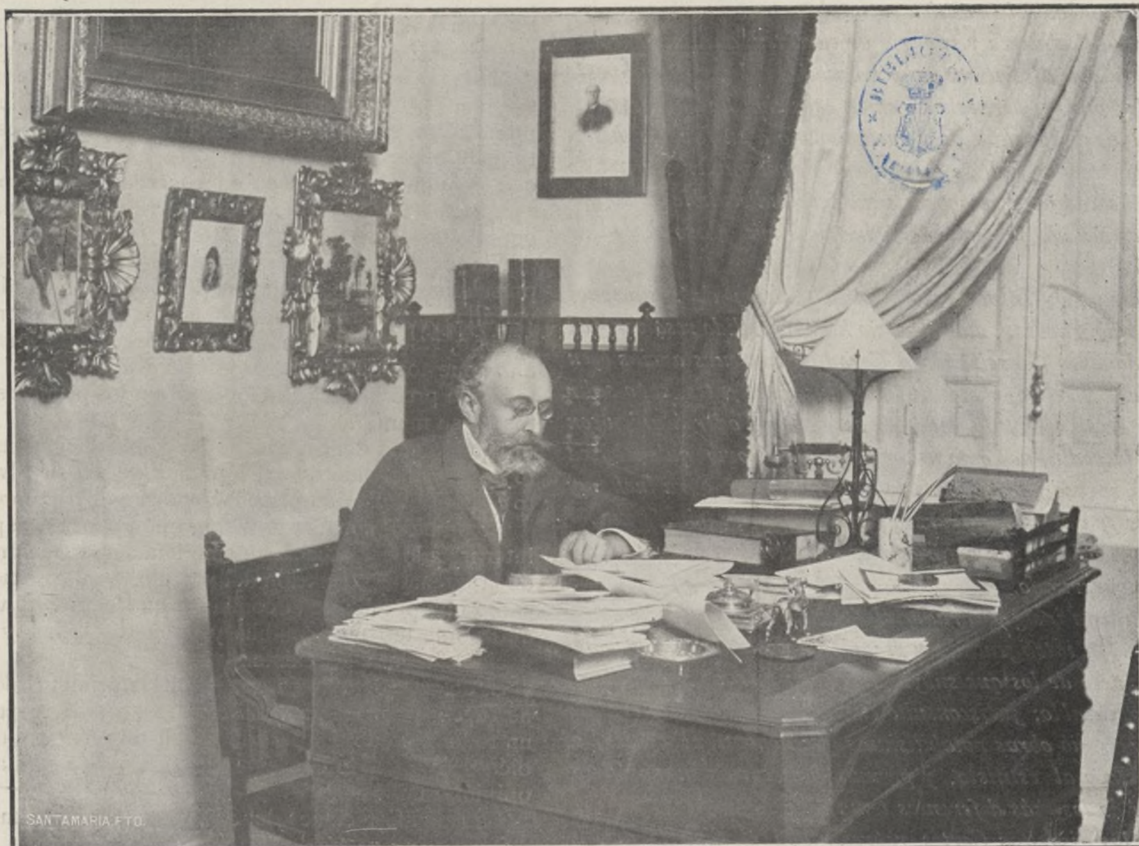
Excmo. Sr. D. Francisco Silvela Presidente del Consejo de Ministros