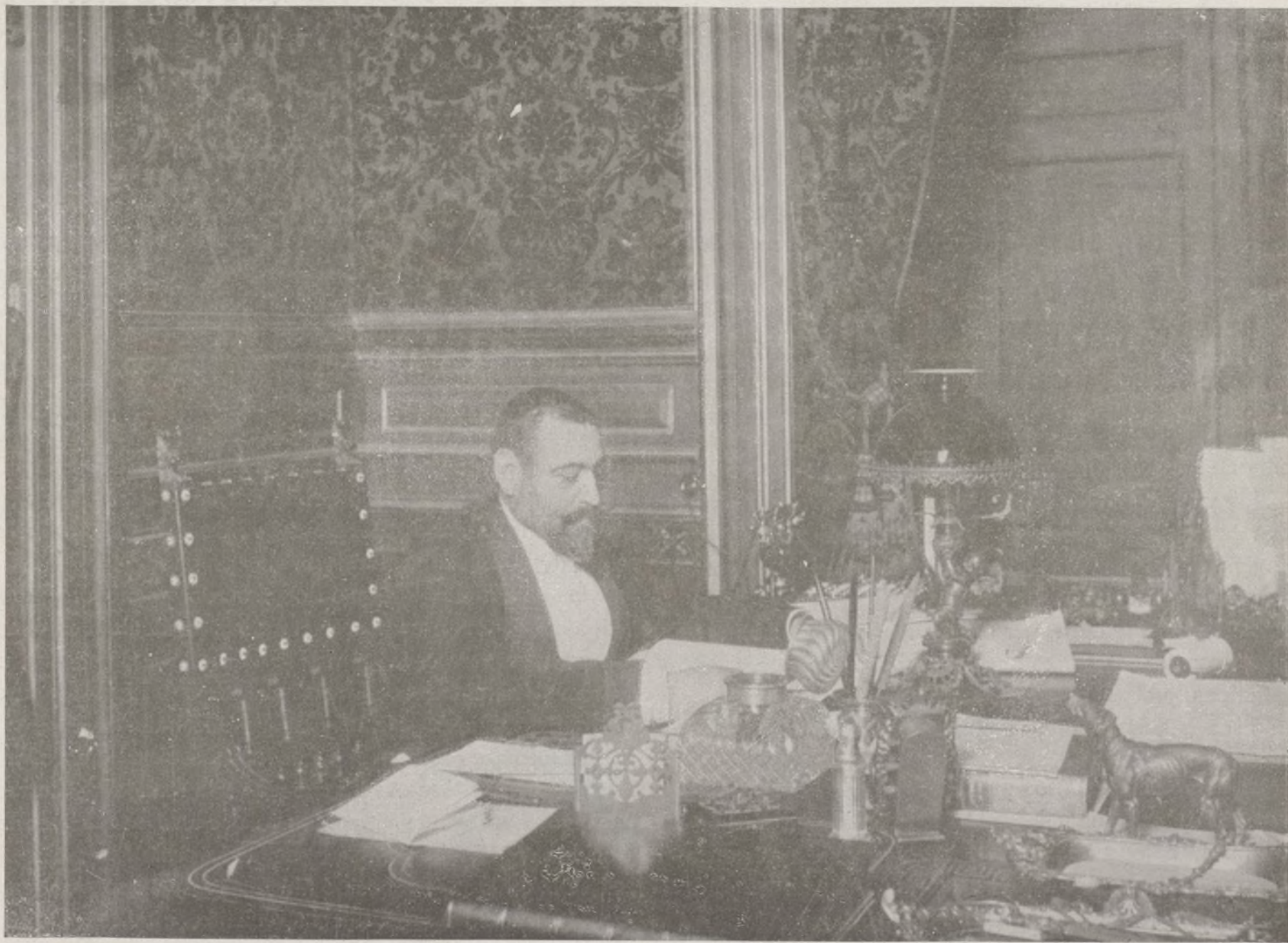
Excmo. Sr. D. Manuel Allendesalazar, Ministro de Agricultura y Obras públicas.

No es el Sr. Allendesalazar un desconocido ni un advenedizo. Trabajador infatigable, su posición política la ha adquirido mediante una labor asidua y tenacísima. Lo que otros alcanzaron por el favor, él lo ha conquistado por el estudio. Merced á una casualidad rara en nuestros Gobiernos, ha obtenido una cartera que corresponde á sus aptitudes. Perteneciente al brillantísimo cuerpo de ingenieros civiles, continuará, y aun ampliará, la política hidráulica del Sr. Gasset.