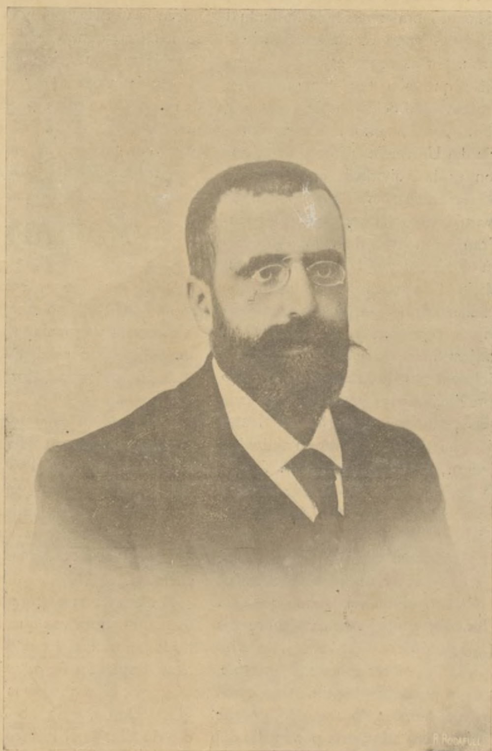
Excmo. Sr. D. José Canalejas y Méndez

Oficinas: Jovellanos, 8, pral. (Junto al Congreso). - Apartado de Correos 48.