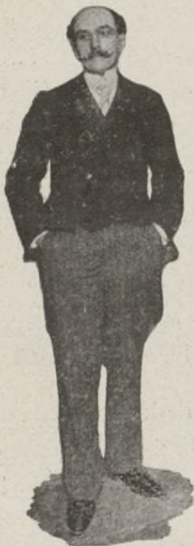
D. Eduardo Dato.

A partir del martes se empezó á ver algo más claro en la cuestión de los suplicatorios, y no fueron pocos los que supusieran que se llegaría á una solución satisfactoria, puesto que todos pare-