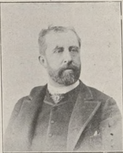
Excmo. Sr. D. Francisco Romero Robledo.

manones también amenazó con apelar á todos los medios reglamentarios para obstruir la obra gubernamental; pero no lo es menos que muchos de los políticos que los siguen no aprueban en absoluto