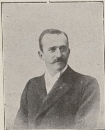
Sr. Conde de Romanones.

manones también amenazó con apelar á todos los medios reglamentarios para obstruir la obra gubernamental; pero no lo es menos que muchos de los políticos que los siguen no aprueban en absoluto