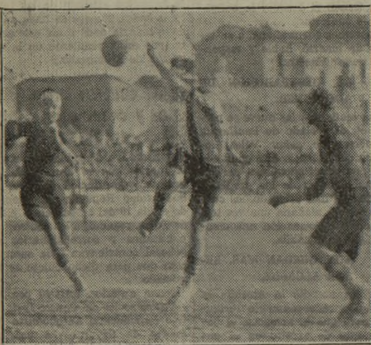
Un buen ataque de la vanguardia levantina