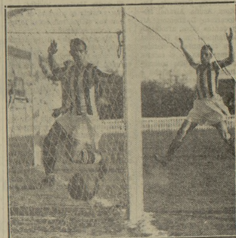
Los jugadores del Castellón, no pueden ocultar su júbilo ante la consecución de un goal para su equipo

no de juego fué saludada con muchos aplausos.