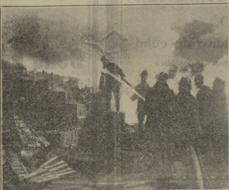
UN ASPECTO DEL INCENDIO