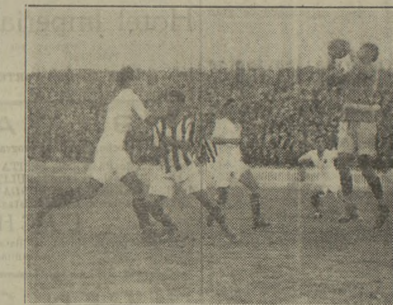
El Valencia en pleno ataque