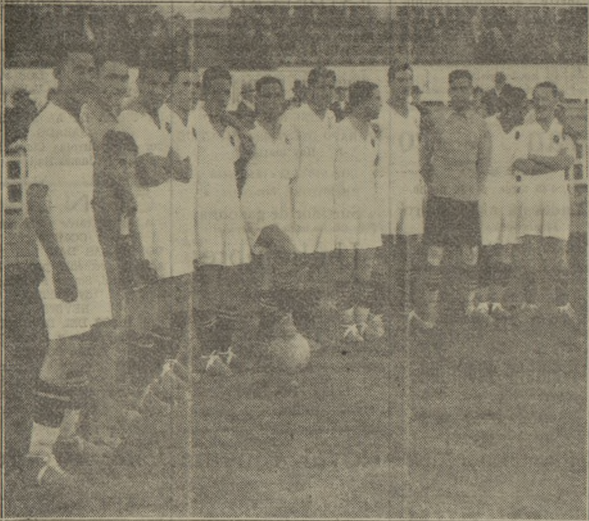
El equipo del Valencia F. C. clasificado como campeón regional

El "score" de uno a cero no refleja la marcada superioridad del Valencia. — Una admirable lección de deportividad del público y jugadores valencianos