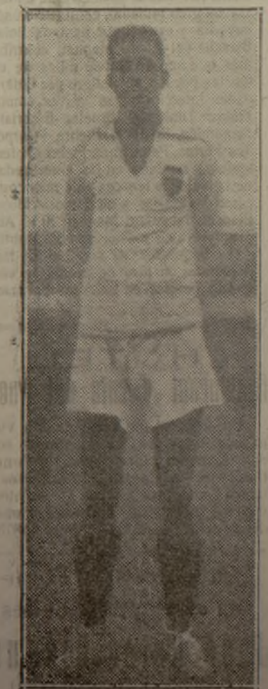
Imossi, el bravo jugador que volvió a triunfar el domingo.

Die deutsche Kolonie hat Gelegens heit, zum ersten Mal diesen Film in Valencia zu sehen und desseben in deut scher Sprache zu hören