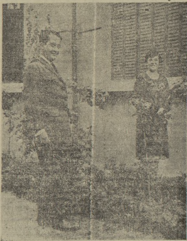
El heroico comandante Franco, con su esposa, antes de ingresar en prisiones militares, donde se hallaba cumpliendo el arresto de diez meses, impuesto por el Gobierno de Berenguer.

La celda de Reyes estaba cerrada con cerrojo.