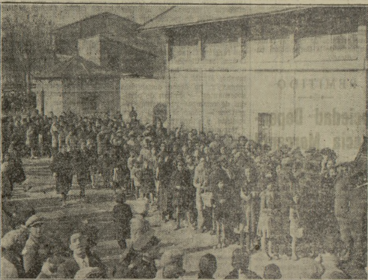
Los vecinos de la calle de Sagunto formaron una larga y bien nutrida cola ante la tenencia de alcaldía de aquel distrito, para cambiar los bonos que distribuyó el Ayuntamiento por juguetes para sus pequeños

La festividad de ayer se celebró esta vez también en la Asociación Valenciana de Caridad como los anteriores, habiéndose repartido juguetes en número de 650, entre