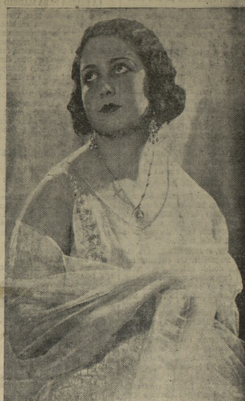
MISS VALENCIA YA FUE ELEGIDA Y CAMBIO SU ATUENDO POR ELEGANTE TRAJE DE NOCHE QUE REALZA SU HERMOSURA