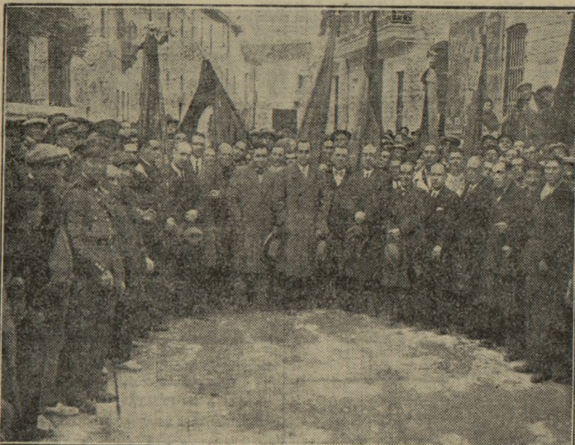
LOS REPRESENTANTES DEL PARTIDO DE UNIÓN REPUBLICANA AUTONOMISTA, EN ALBORAYA

Añade que la monarquía presentaba a los republicanos como enemigos de toda religión y dice que esto es una falsedad. Se refiere a las intromisiones del pulpito y consigna que esto no lo consentirán los republicanos, porque España se proclamó ya mayor de edad.