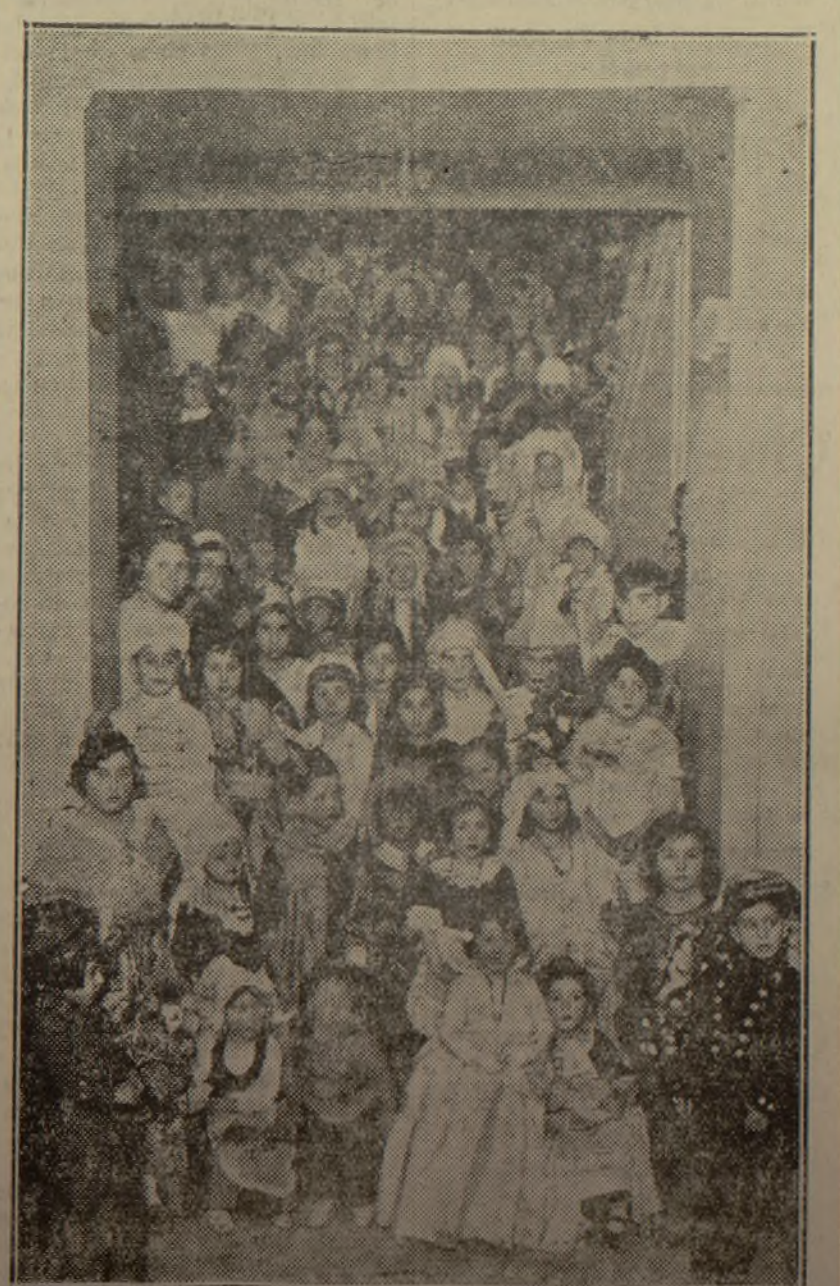
He aquí un grupo parcial de niños que acudieron a los bailes organizados por la Asociación de la Prensa, que lucieron originalísimos disfraces