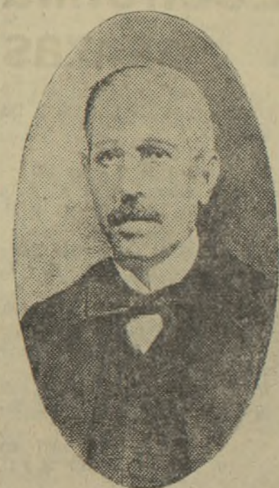
«Yo os juro—gritó Figueras desde una ventanilla bajas del Congreso—que los diputados de la minoría republicana, saldremos de aquí, o con la República o muertos.»

No pudo ni él ni nadie decir más. Esto ocurría el 10 de Febrero del año 73.