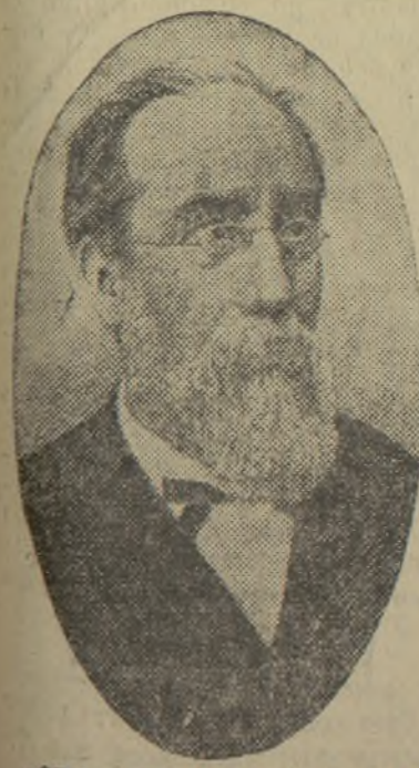
«ORDEN, LIBERTAD, JUSTICIA: Tal es el lema de la República. Se contrariarían sus fines si no se respetara e hiciera respetar el derecho de todos los ciudadanos, no se corrigieran con mano firme todos los abusos y no se doblegaran al saludable yugo de la Ley todas las frentes. Se los contrariarían también, si no se dejara ancha y absoluta libertad a las manifestaciones del pensamiento y la conciencia; si se violara el menor de los derechos consignados en el título I de la Constitución de 1809. No se les contrariarían, menos, si por debilidad se dejara salir fuera de la órbita de las leyes, a alguno de los partidos en que está dividida la nación española. Conviene no olvidar que la insurrección deja de ser un derecho universal el momento en que, universal el sufragio, sin condiciones la Libertad y sin el límite de la autoridad real, la soberanía del pueblo, toda idea puede difundirse y realizarse sin necesidad de apelar al bárbaro recurso de las armas.»

(Palabras de Salmorón al encargarse del Gobierno de la República)