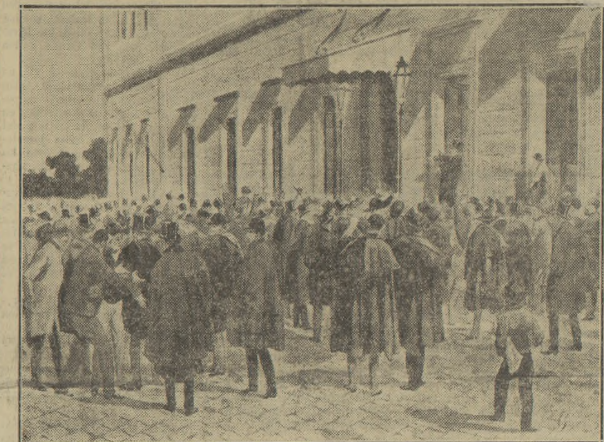
ESTANISLAO FIGUERAS SE DIRIGE AL PUEBLO EL DIA 10 DE FEBRERO DE 1873 Y LE MANIFIESTA, ANTES DE ENTRAR EN EL CONGRESO, QUE SERIAN MUERTOS O CUANDO SALIERAN DE ALLI YA HABRIA SIDO PROCLAMADA LA REPUBLICA

Los cavernícolas, restos de aquel pasado sangriento, con vestimenta y denominaciones modernas, la-