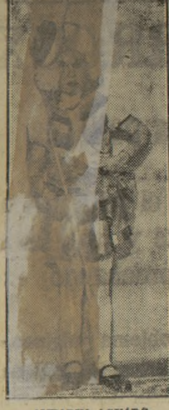
AMPARIN AGUADO (Modelón)