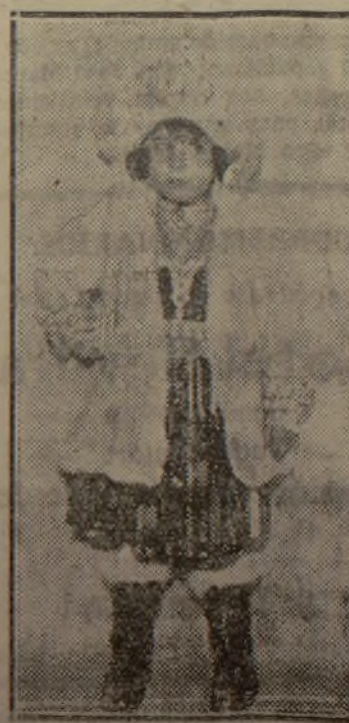
MARIA SOLO DE LA VINA (Alceana rusa)