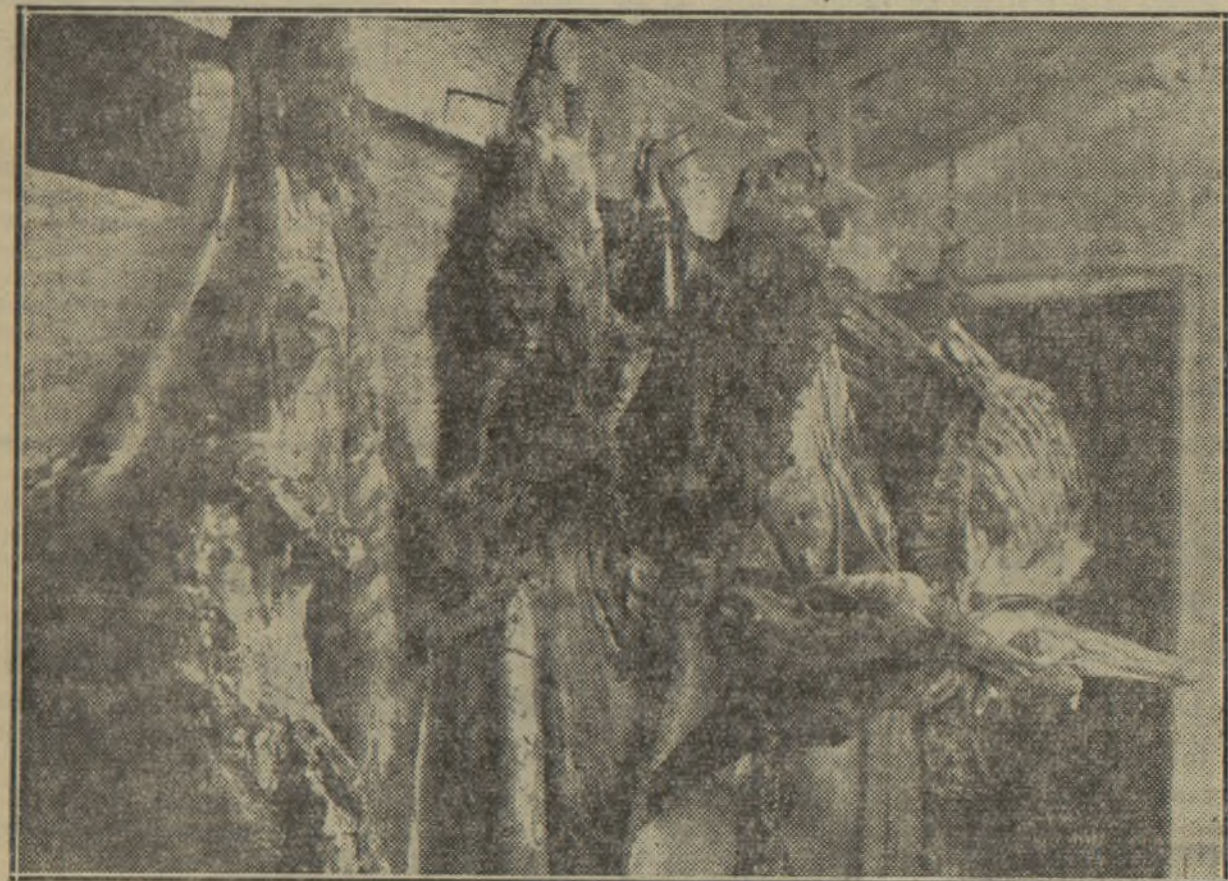
HABITACION EN QUE SE ALMACENABAN LOS CUARTOS DE BURRO PARA LA VENTA Y DISTRIBUCION.

asnos preparados en cuartos, sus pieles y sus cabezas y sus despojos.