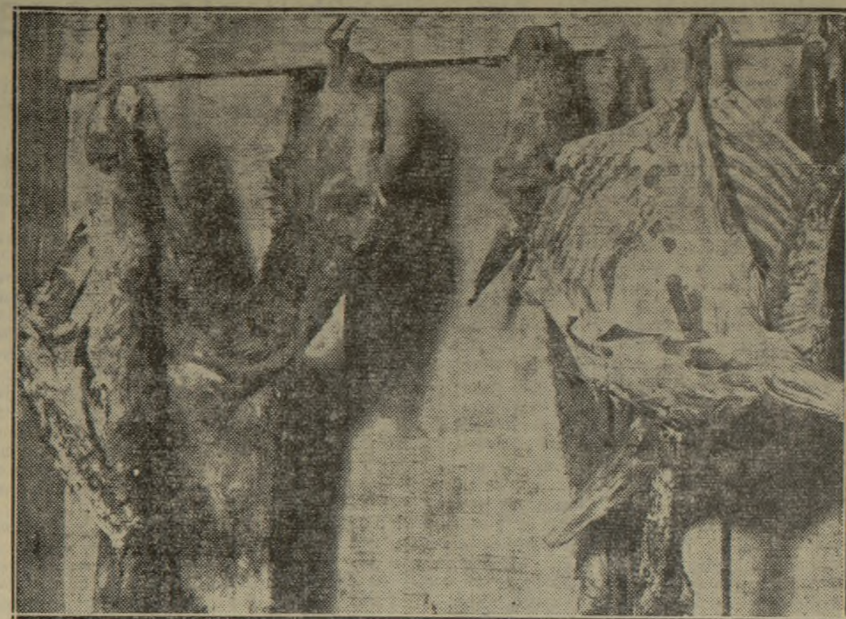
EN ESTE CUARTO SE DESOLLABA A LOS ASNOS Y SE PUEDE VER DOS PIELS CON CABEZA Y UN CUARTO DE BURRO.

En el matadero de la calle de San Luis, eran recogidas por el