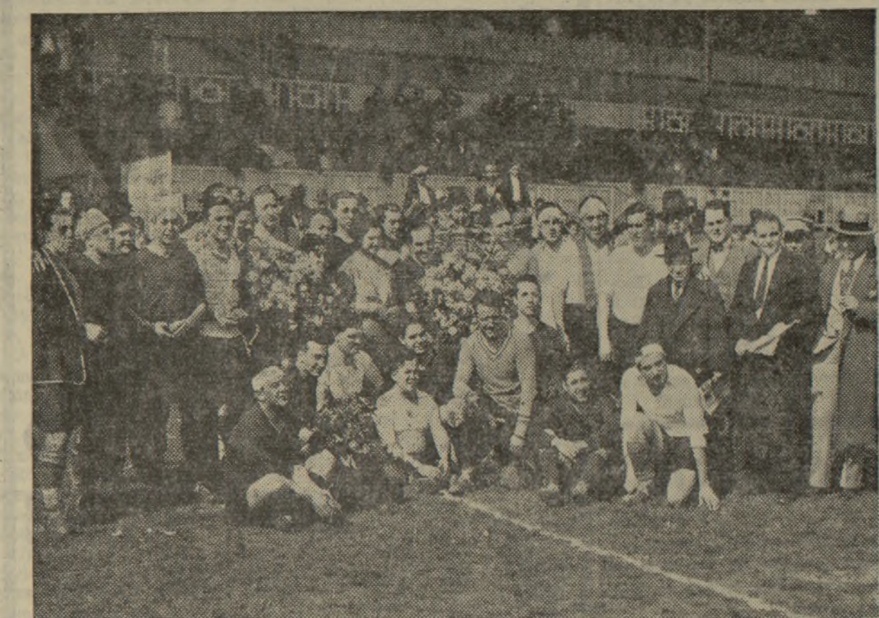
PERIODISTAS DEPORTIVOS CATALANES Y VALENCIANOS RODEANDO A MISS VALENCIA ANTES DEL RESIDO COMBATE DE FUTBOL EN MESTALLA

tremebunda entre los «plumíferos» deportivos catalanes y valencianos.