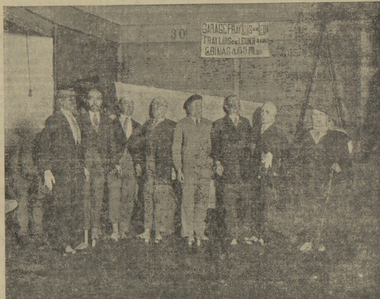
LOS MUSECOS QUE FIGURAN EN LA FALLA QUE LOS VALENCIANOS RESIDENTES EN MADRID CONSTRUYERON. LOS CUALES REPRESENTAN LOS MIEMBROS DEL ACTUAL GOBIERNO Y QUE HA SIDO TRAIDA A VALENCIA PARA EXHIBIRLA EN EL CONCURSO FALLERO Y SE QUEMARA EL DOMINGO EN LA GLORIETA DE BILBAO, EN MADRID, A LOS ACORDES DE LA BANDA MUNICIPAL.