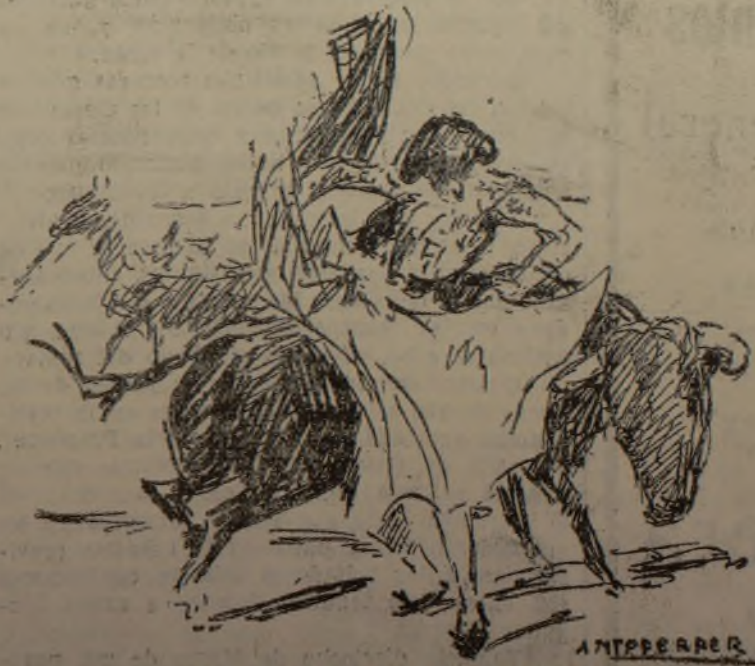
UNAS CHICUELINAS DE BARRERA

Y vino la ovación, la oreja y la salida a hombros.