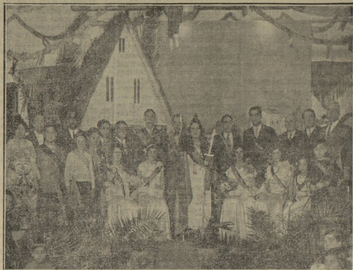
LA PRESIDENCIA Y COMISION ORGANIZADORA DE TAN BRILLANTE FESTIVAL, CELEBRADO EN LA CASA DE LA DEMOCRACIA DE LA VEGA.

A continuación comenzó el baile, que fué magnífico, derro-