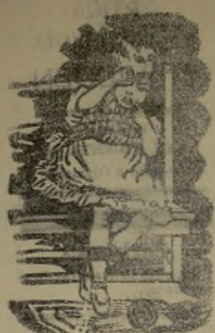
Antes de tomar la DENTINA