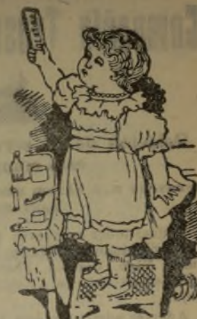
Después de tomar la DENTINA

Laboratorio y farmacia Cañizares, calle de Caballeros, número 47, Valencia