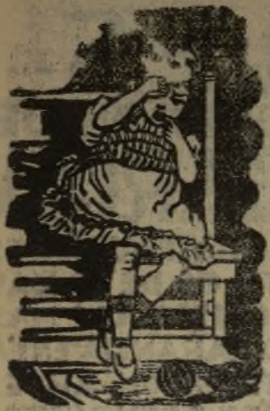
Antes de tomar la DENTINA