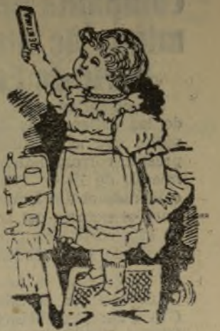
Después de tomar la DENTINA

Laboratorio y farmacia Cañizares, calle de Caballeros, número 47, Valencia