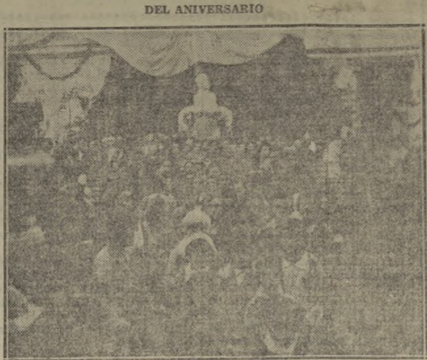
He aquí a los niños del grupo escolar Blasco Ibañez, que alienta en Burjassot Mario Blasco con todo el fervor de su ideal mantenido con generoso desprendimiento, honrando la memoria del Maestro, cuya effigie campea victoriosa y ufana ante esta generación que mantendrá viva su obra.

ANTONIO ZOZAYA. (Prohibida la reproducción.)