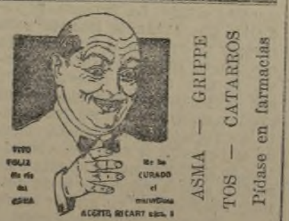
Depósito: Dr. Greus, P. Sta. Catalina, 2

La banda había sido contratada para veinte audiciones, y ahora tiene que dar diez más, doblando algunos días, por tener precisión de estar en Alicante para empezar su temporada en España. A los franceses les ha hecho mucha gracia los trucos que emplean los de El Empastre.