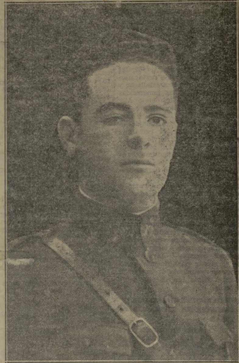
Fermín Galán, héroe de una causa justiciera, cuya figura ha adquirido magníficos caracteres de símbolo el mismo día en que fué fusilado.