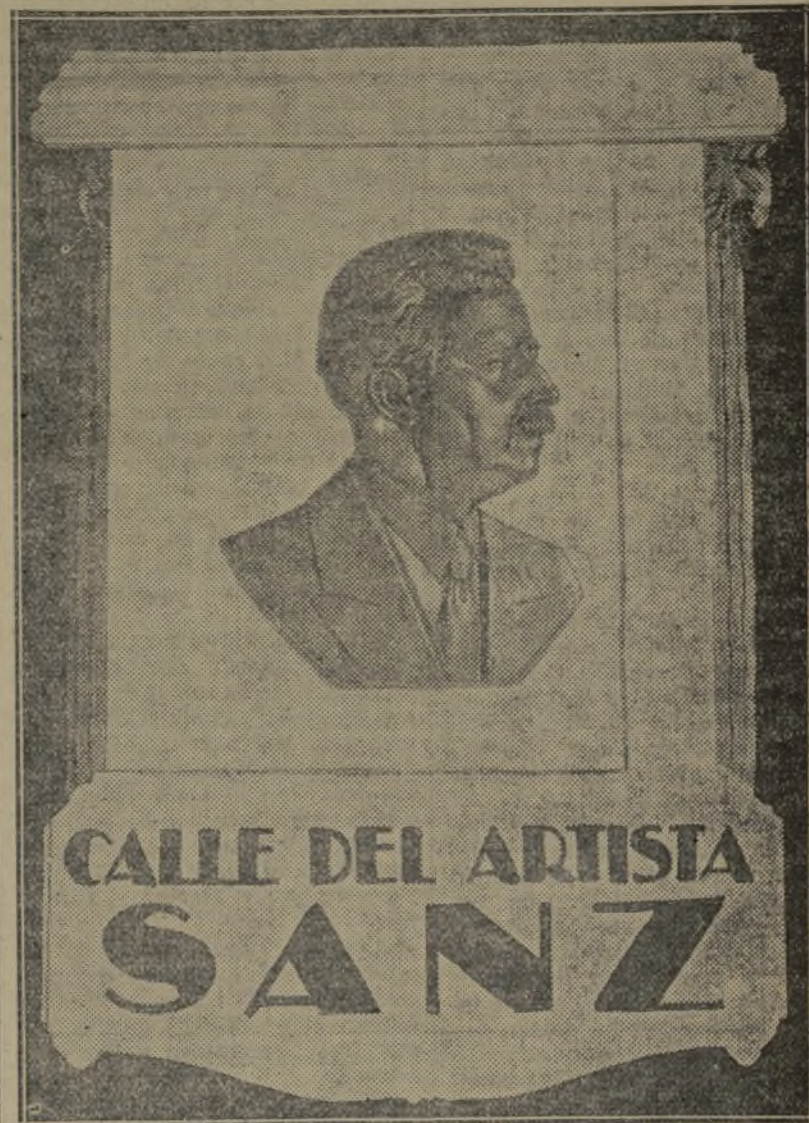
Américas. Por todas partes pasó sus muñecos con éxito extraordinario, y donde fué una vez hubo de hacerlo repetidamente este español inquieto y audaz, que llevó en sus empresas por escudo a España y a su patria chica en el corazón.