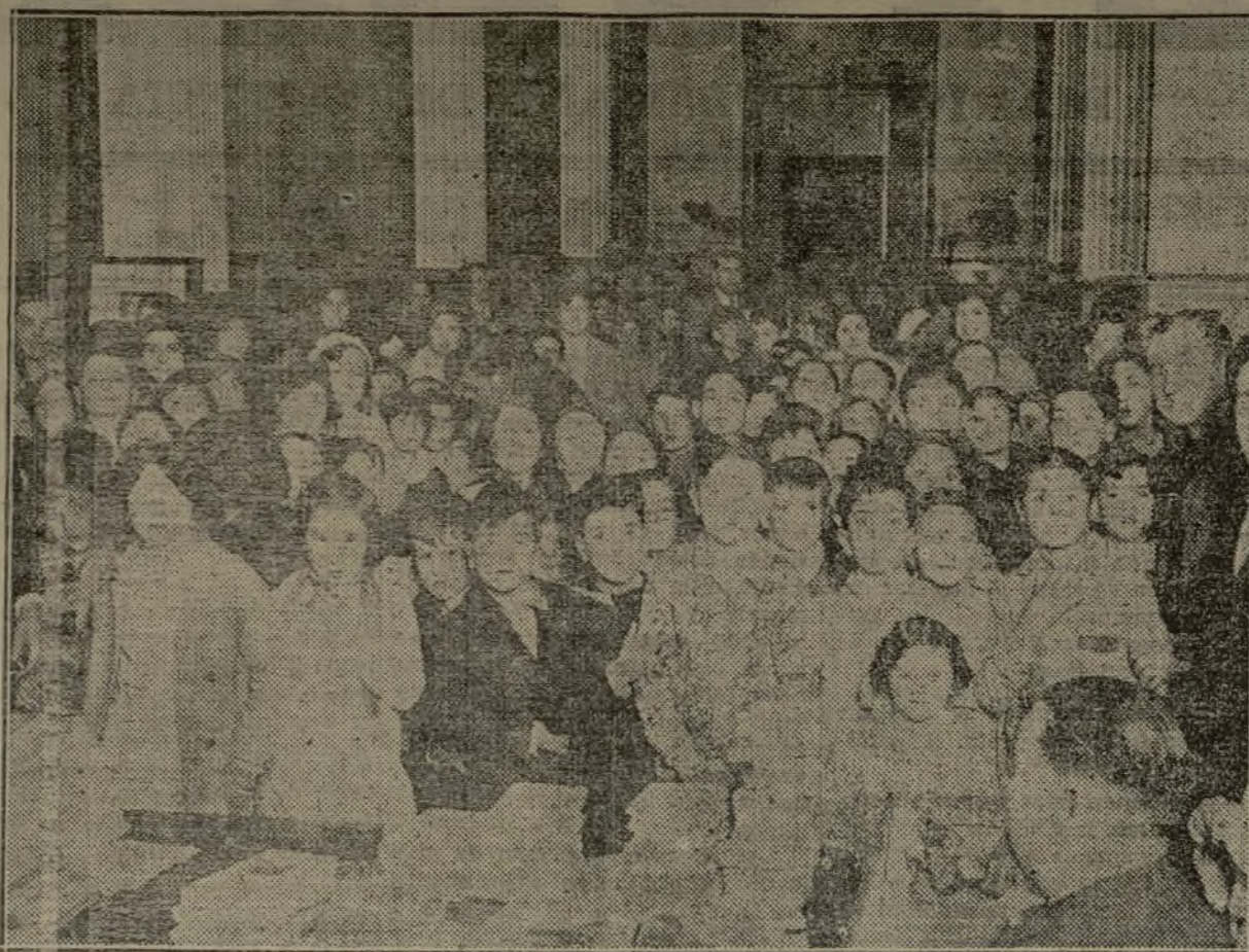
Un aspecto del reparto de libros entre los niños que en conmemoración del 11 de Febrero se celebró ayer tarde en la Casa de la Democracia.