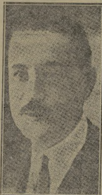
Don Miguel Maura

Para hacer la travesía habíase alquilado en un puerquito montañés una lancha motora que debía traerme a San Juan de Luz. En el día y a la hora convenidos me trasladé yo desde Bilbao al