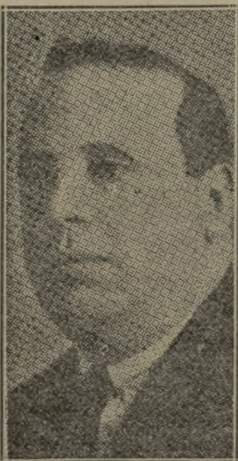
Don Indalecio Prieto

Creo que aunque el movimiento se haya frustrado, son positivos los resultados fecundos del mismo. Cuando en una de las últimas reuniones celebradas en Madrid por el comité revolucionario que había de erigirse en Gobierno provisional hicimos un examen detallado de los elementos con que contábamos, aun descontando los que pudieran faltar, estuvimos unánimes al apreciar que no podía prescindirse del movimiento, y que creyéndolo inevitable, no podíamos dejarlo decapitado. Nuestro deber llegaba incluso a aceptar la responsabilidad de un posible fracaso, y entonces dije yo que tenía por seguro que el fracaso, si sobrevenía, sería fecundo.