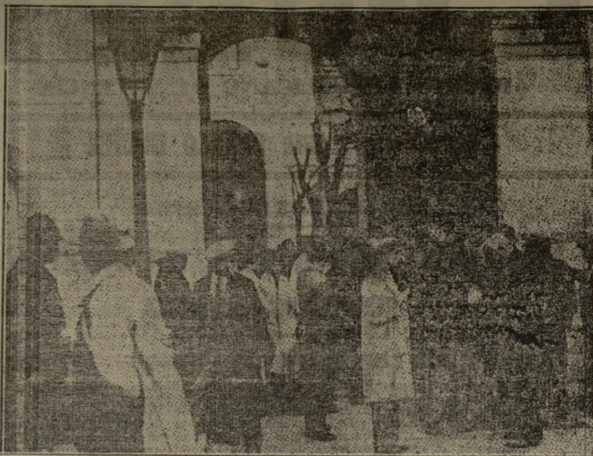
Público a la puerta de la Cárcel Modelo que ha ido a dejar tarjeta y a firmar en los pliegos, como homenaje a los presos políticos.

En vue de l'établissement des tableaux de recensement de la 2 e me fraction de la classe et 1 re fraction de la classe 1931, les jeunes gens nés du 1 er Jan. au 31 Décembre 1910 et du 1 er Jan. au 31 Mai 1911, ainsi que les ajournés et omis de classes antérieures, sont tenus de se présenter au Consulat de France à Valence, rue Colom, 23 (de 10 heures à midi, sauf les jours fériés) avant le 1 er Mars prochain.