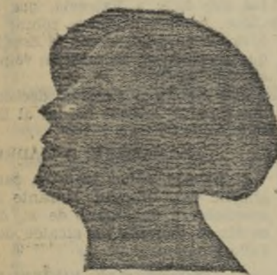
Carlota Ibáñez Pla, actriz que une a su indiscutible belleza un gran temperamento dramático...