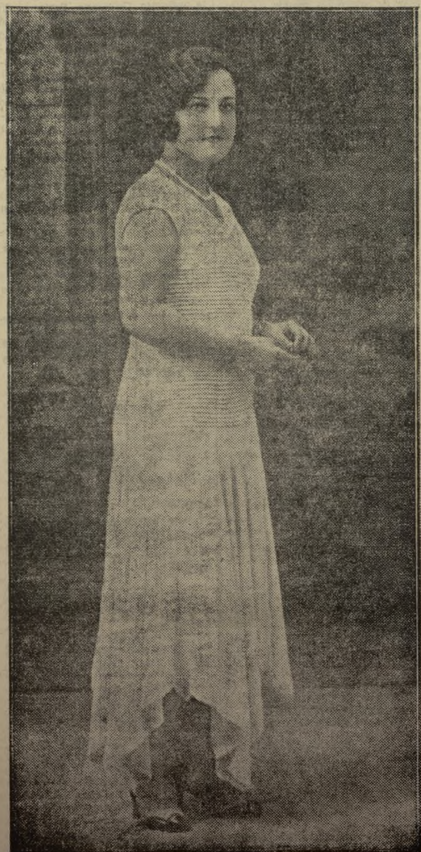
Por si algo más pudiera faltarle a Carcagente, tiene también un ramillete de mujercitas lindísimas. He aquí una, cuya gracia sabe realzar todavía más el encanto, la belleza y fragancia que sus naranjadas parece haber tenido el anhelo de compartir.