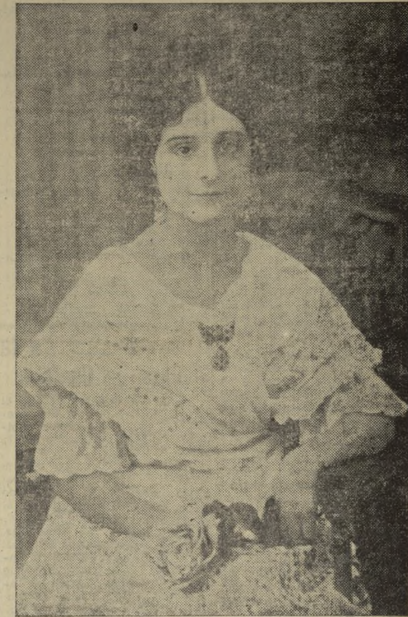
Aún palpita el tipismo del atavio huertano en toda la región. He aquí a esta lindísima carcagentina que rememora costumbres románticas de la huerta valenciana con sus galas de labradora.

Mención especial merece la excelencia del servicio de luncas para bodas, bautizos, etc., para lo que nada en absoluto escatima, siendo de notar no solamente la exquisitez de sus preparados de repostería, sino la lujosa presen-