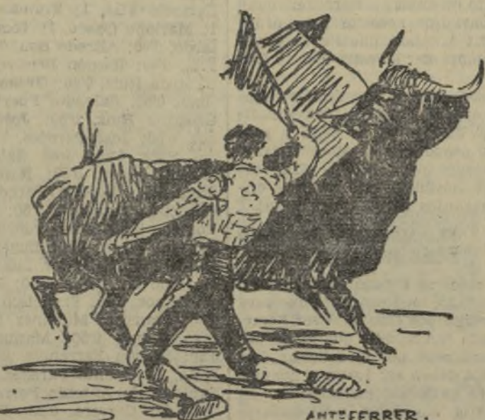
Carnicerito de Méjico en un pase de rodillas

Peso de la canal de los toros: Primero, 247 kilos; segundo, 291; tercero, 284; cuarto, 293; quinto, 281; sexto, 315.—Total, 1.711 kilos. RIANO.