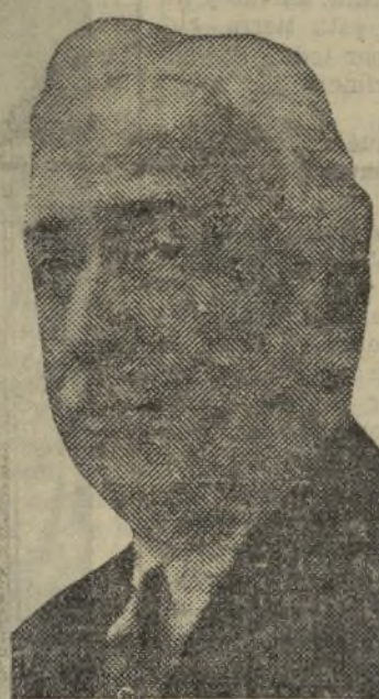
Don Niceto Alcalá Zamora