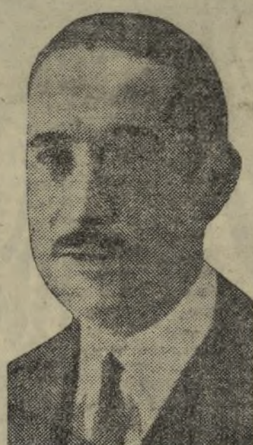
Don Miguel Maura