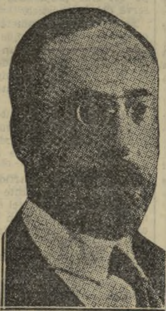
Don Fernando de los Ríos