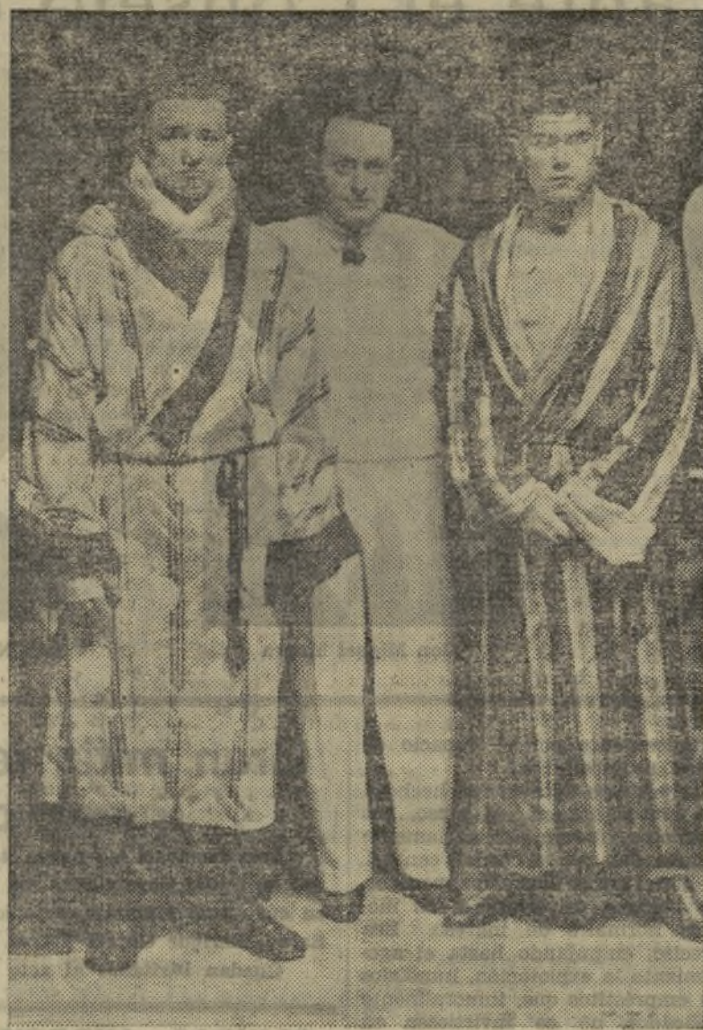
He aquí a los tres protagonistas del campeonato de Europa. Boxeadores y árbitro posan ante el objetivo de Vidal, bien ajenos de la protesta tumultuosa con que el público había de acoger la decisión.

manager de Martínez ha presentado la oportuna reclamación.