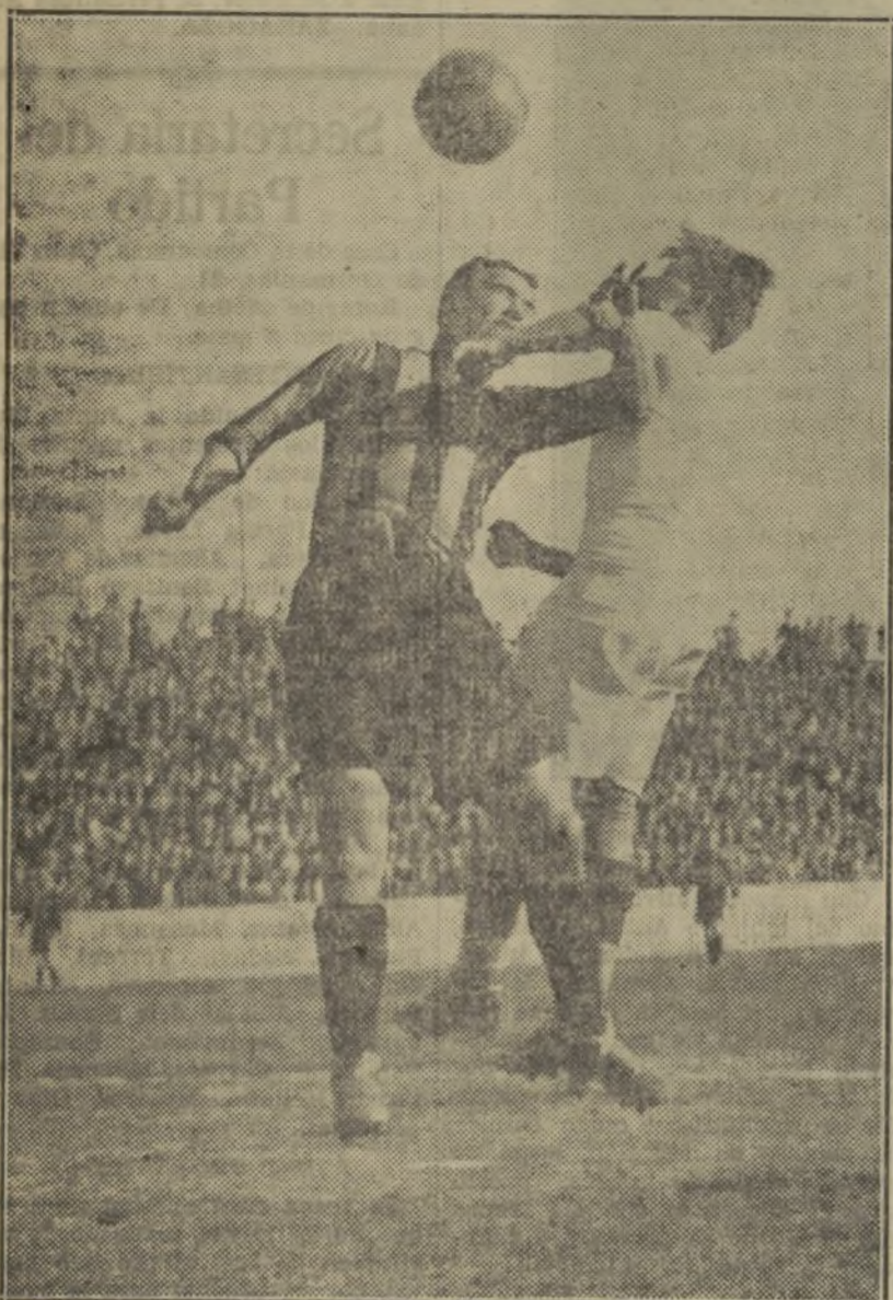
Un momento interesante del partido Valencia-Iberia

Y así el Valencia se volcó por completo sobre el Iberia de Zaragoza. Desde el principio del en-