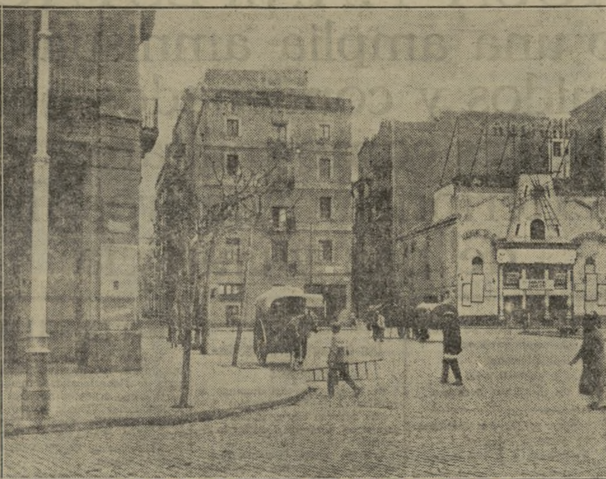
Trozo del Paralelo en que será colocada la placa del ilustre novelista y que en lo sucesivo se denominará: «Plaza de Blasco Ibáñez»