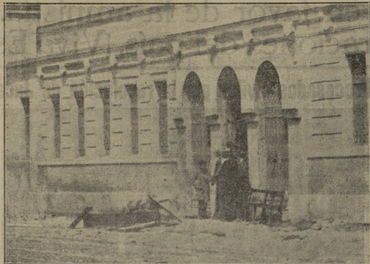
Los escolares amontonan bancos, papeles, un retrato simbólico y representativo, que presidía la Real Academia de Medicina, que ardió en auto de fe, frente a la Facultad de Medicina.