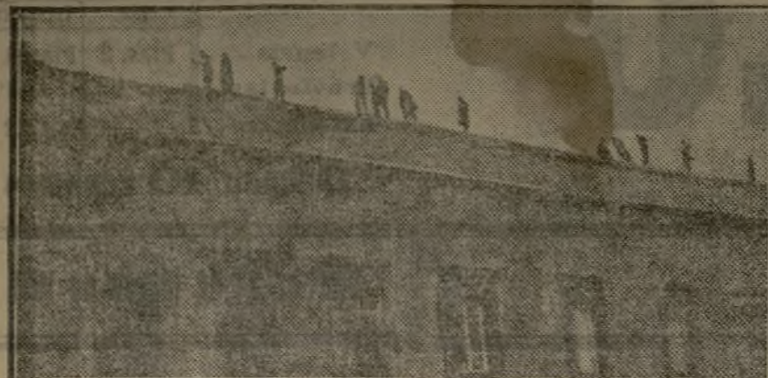
Los estudiantes en el tejado de la Facultad de Medicina de Madrid, donde se hicieron fuertes contra la fuerza pública.

las mesas de secretaría, estando restablecidas las garantías constitucionales.