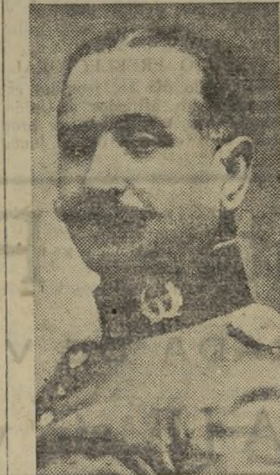
El general Queipo de Llano

—Usted ya sabe—empieza diciendo con un dejo de profunda