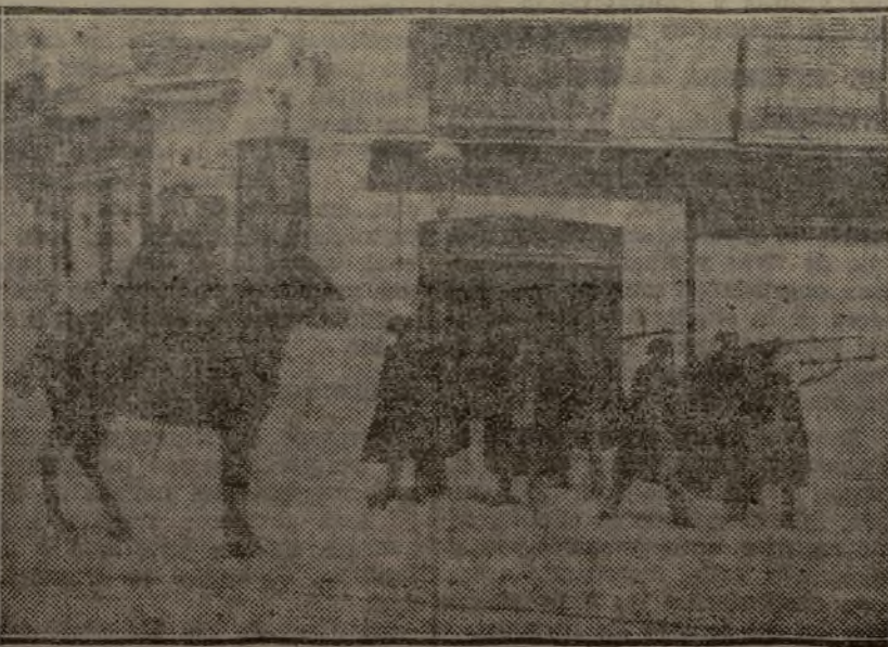
La guardia civil disparando contra la Facultad de Medicina de Madrid