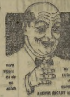
Depósito: Dr. Gens, P. Sta. Catalina, 2

(Continúa abierta la colecta en la Administración de EL PUEBLO y en la Secretaría del Partido, Casa de la Democracia.)