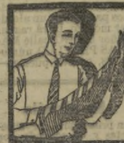
La casa de las corbatas

Todos los meses nuevos modelos. Grandes ocasiones a mitad de precio.