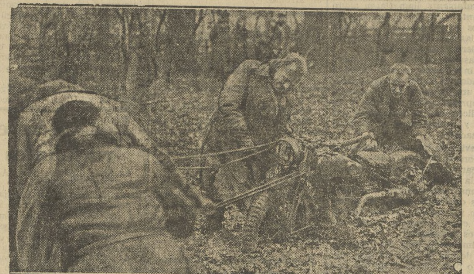
EN EL FANGO DETENIDO DURANTE LAS PRUEBAS DE BICICLETAS A MOTOR EN NOTTINGHAM, INGLATERRA