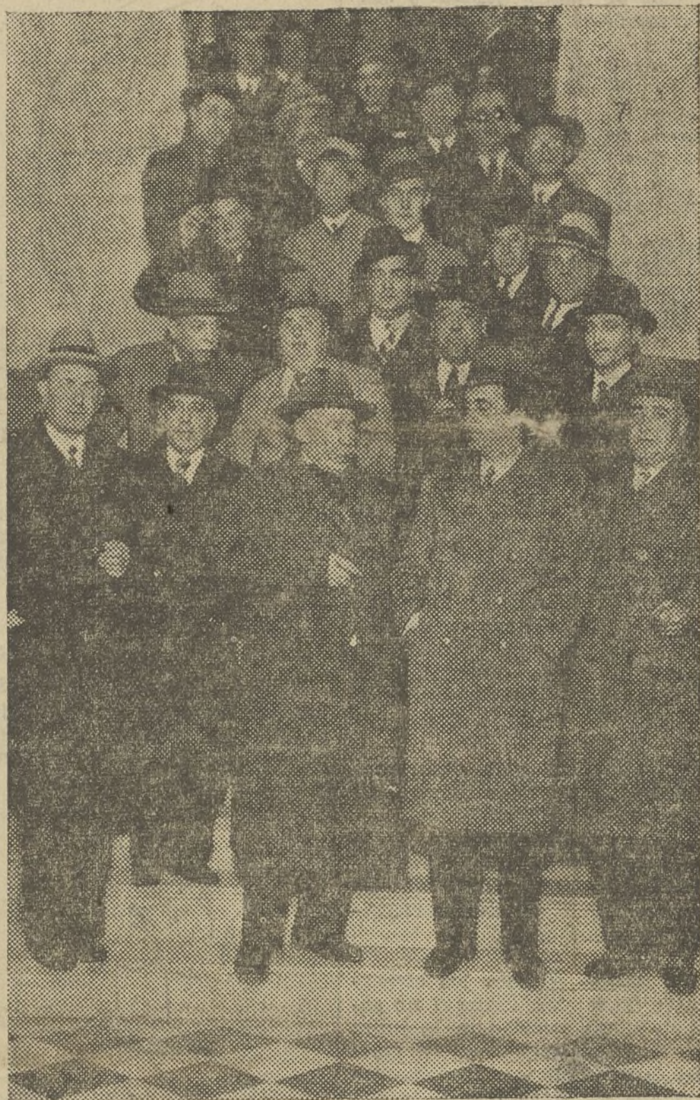
EL ILUSTRE ESCULTOR DON MARIANO BENLLIURE AL SALIR DEL AYUNTAMIENTO DE BURJASOT, DONDE FUE OBSEQUIADO CON UN BANQUETE

cilla, demostrativa de su antigua y buena amistad con Blasco Ibáñez y de su valencianidad: «Hago el monumento a Blasco Ibáñez. En cuanto vaya a Valencia iré a Burjasot y se elegirá el punto de su emplazamiento.» Y este momento