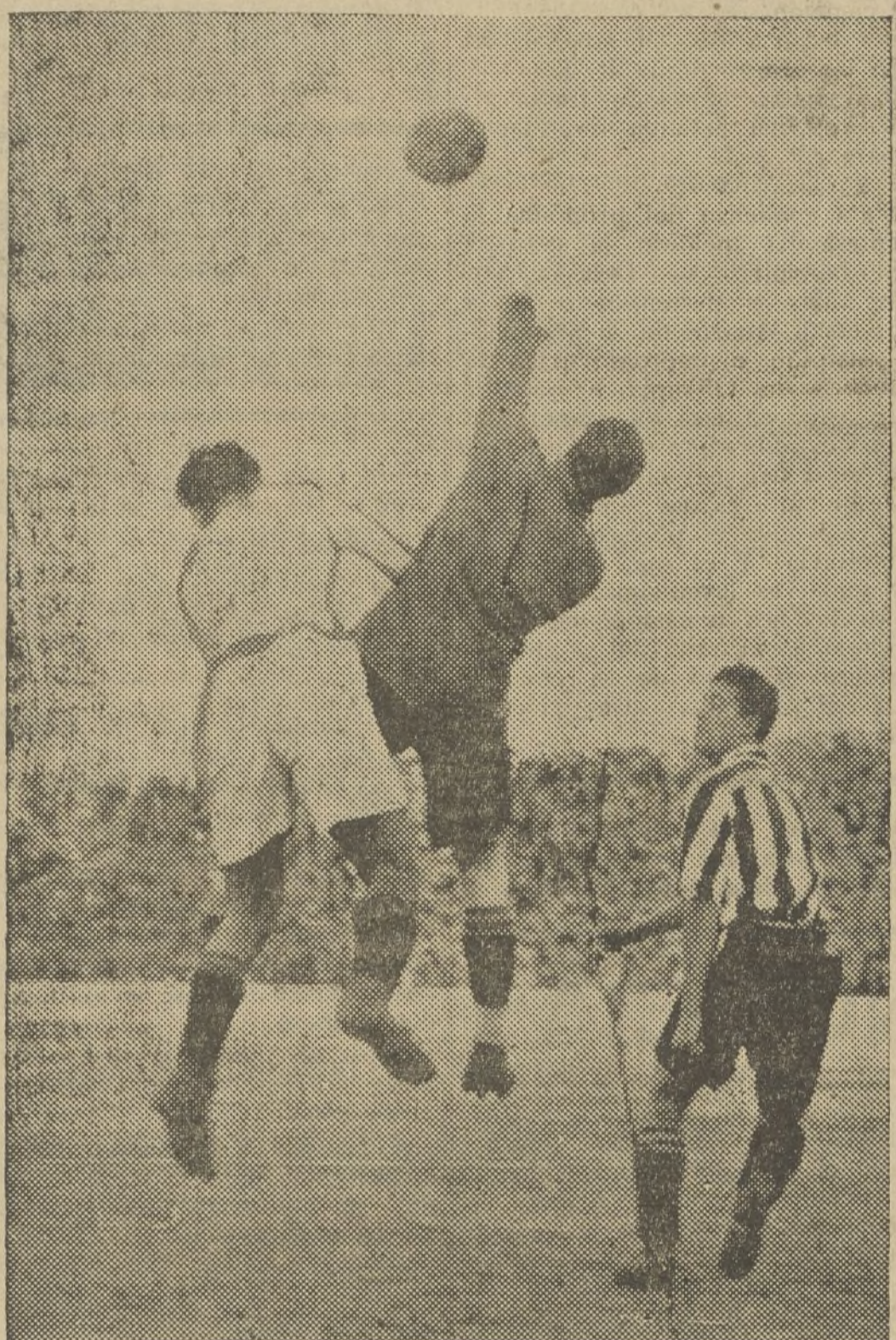
UN DESPEJE DEL META ATHLETICO, ACOSADO POR NAVARRO

Ni unos ni otros. En el equipo del Valencia no hubo un solo jugador digno de encomio ni de ser citado como superior al resto. Todo el grupo valenciano se vino abajo al marcar los dos goles de aquel goal tonto. Luego al asegurar aún más la ventaja los forasteros, el Valencia acabó ya de hundirse. No tenía remedio la cosa. Y en plan de naufragos los jugadores valencianistas, hicieron un segundo tiempo desdichado. Sin ninguna táctica, en plena desorientación.