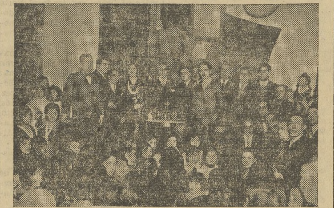
Momento de ocupar el estrado los padrinos del nuevo banderín, acompañados por el presidente del Consejo Federal, oradores, junta del Centro Republicano Autonomista del distrito del Centro y presidente de la Juventud de dicho casino

El presidente de la Federación de Juventudes don Leopoldo Que-