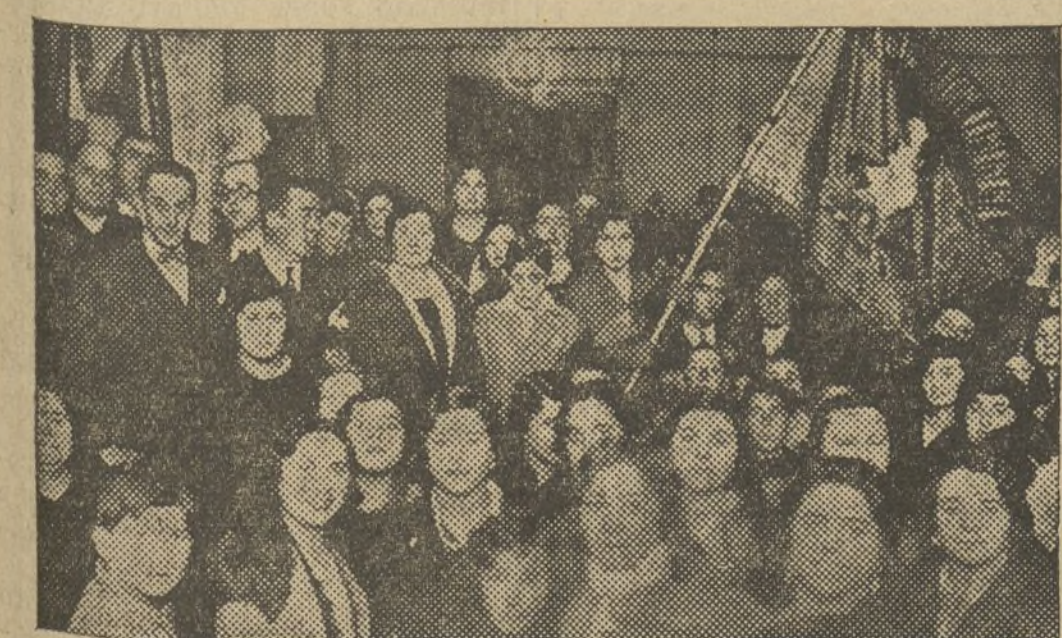
Asistentes al acto organizado por la Agrupación Feminista Los Enemigos de la Mujer en el local del Centro Republicano Antonomista El Ejemplo, con motivo de la entrega del banderín a dicha Agrupación.