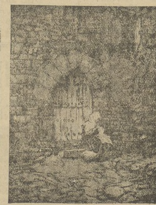
UN AGUAFUERTE DE BLAT

Una felicitación al artista es poco. No lo hacemos, por tener la seguridad de que nada es lo hecho ante lo que efectuara. Limitamos nuestro comentario de hoy a recomendar una visita a la exposición de Ismael Blat, en la Federación Industrial y Mercantil, sabiendo que será unánime el aplauso.