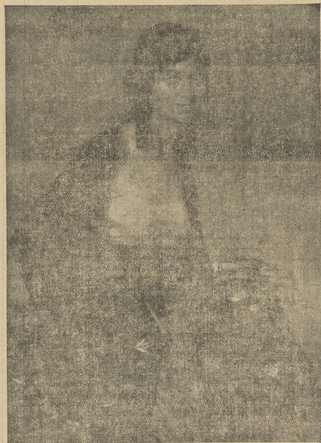
«TIRABUZONES NEGROS», HERMOSO LIENZO DEL GRAN PINTOR VALENCIANO