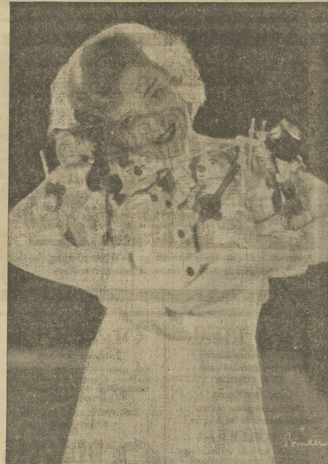
MARTA EGGERTH, la deliciosa estrella de la pantalla, que muy pronto se presentará en otra gran opereta cinematográfica, «Audiencia Imperial», perteneciente a la Aafa y distribuida por Exclusivas La Sasopi