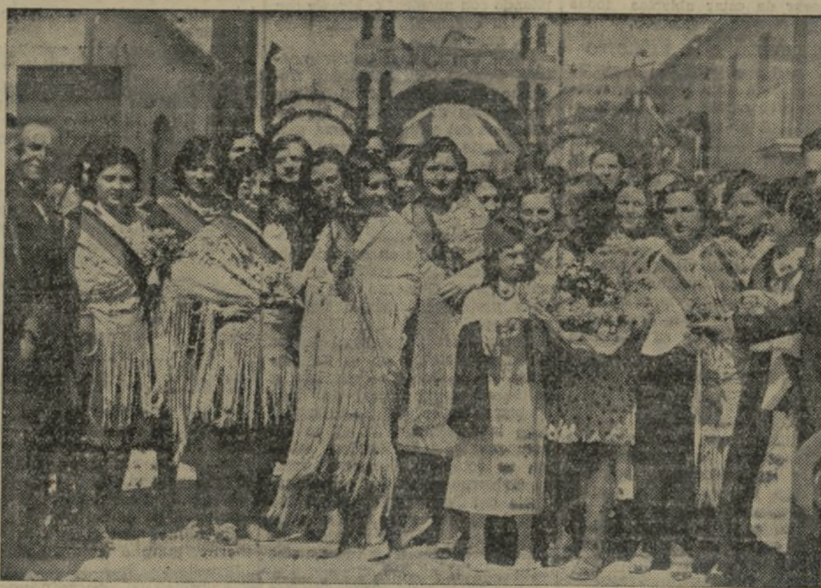
BELLAS MUCHACHAS DE UTIEL QUE OFRECERON HERMOSOS RAMOS DE FLORES AL PRESIDENTE

EL PUEBLO saluda con el máximo fervor y con toda emoción a los ilustres representantes del Poder que han sido nuestros huéspedes, deseándoles al mismo tiempo que el acierto les acompañe en toda labor que realicen para elevar el alma y la vida nacional, que habían sido postergadas en la abyección por el régimen monárquico.