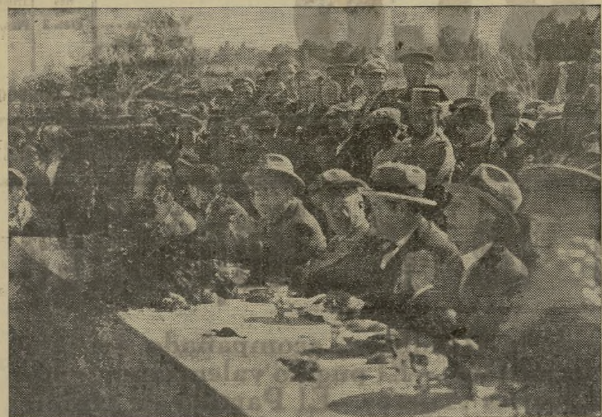
LA MESA PRESIDENCIAL DEL BANQUETE QUE AYER SE CELEBRÓ EN HONOR DEL PRESIDENTE DE LA REPÚBLICA CON MOTIVO DE LA INAUGURACIÓN DE LAS OBRAS DEL PANTANO DE BLASCO IBÁÑEZ, EN EL MAS DEL CABALLERO

alegría que la realización de la obra proporciona a toda España, sea pronto compartida con los ciudadanos que me honro representar quienes desean a vueces una larga vida para bien de la República.